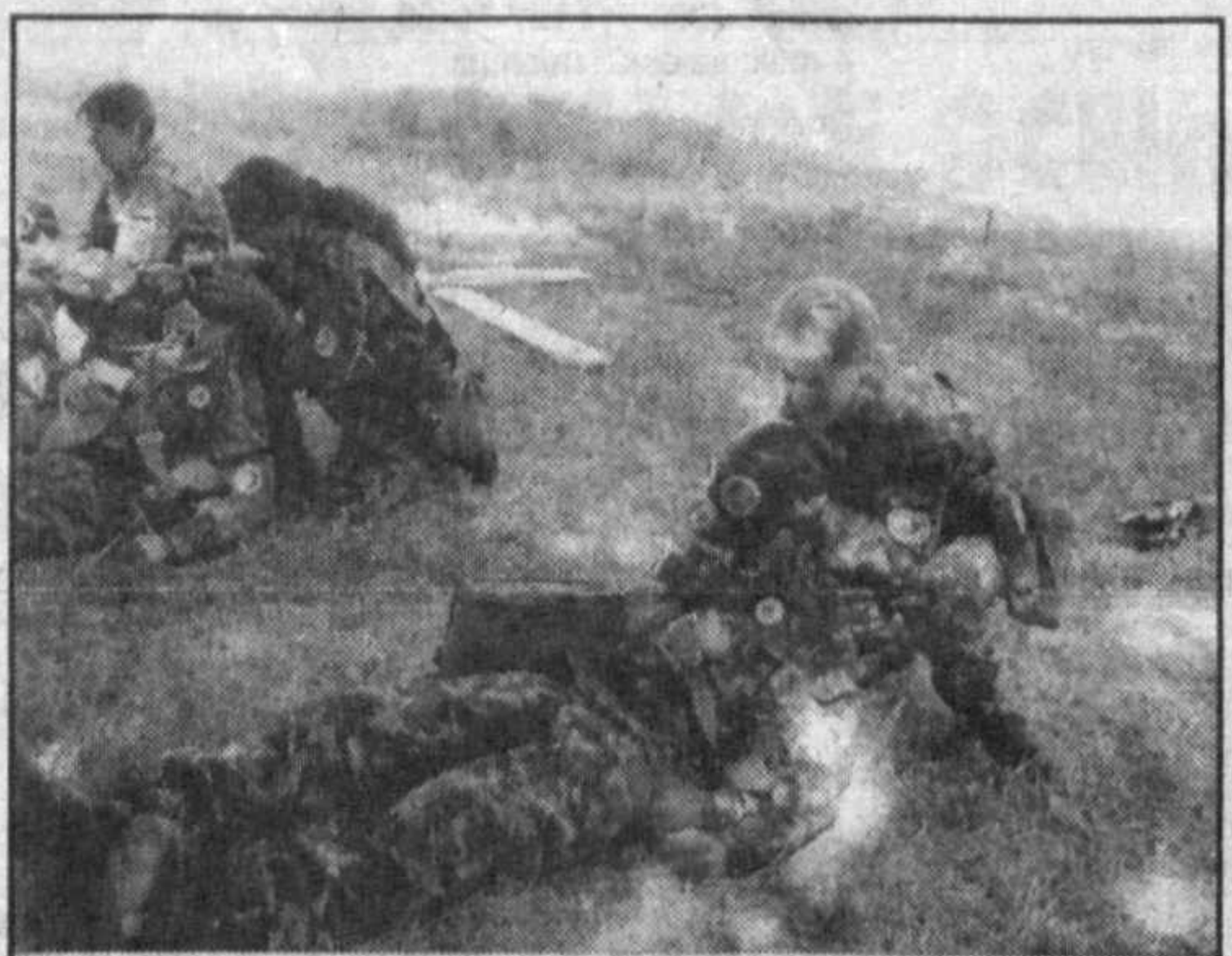
НА СНИМКАХ: члены команды «Метрополитен» Шайхантаурского района столицы выполняют команду; юные санитары оказывают помощь «пострадавшим».