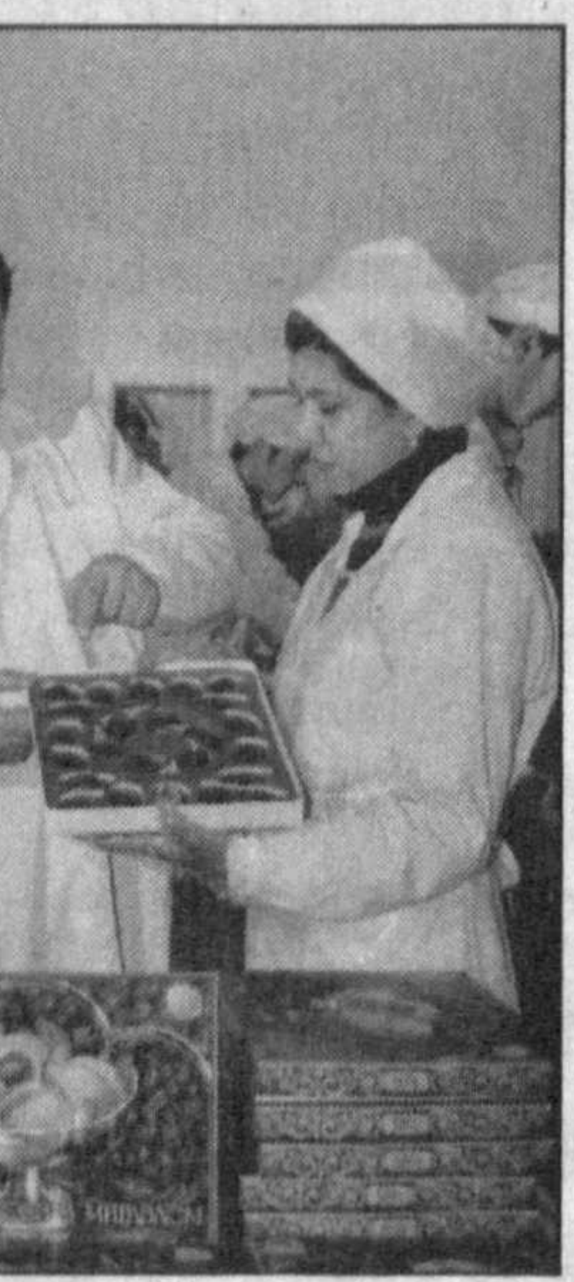
нио взаимовыгодного экономического сотрудничества, увеличение товарооборота между двумя государствами.

К сказанному можно добавит, что винит украинскую делегацию во главе с Президентом страны Леонидом Кучмой в нашу республику позволят вывести узбекско-украинские взаимоотношения на качественно новый уровень развития, будет способствовать укреплению и расшире-