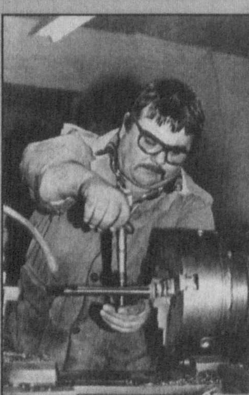
Куйичирчикское опытно-механическое АО «Достабад» специализируется на изготовлении запасных частей для хлопко-промышленных подразделений и хлопзаводов. Они делают диски для джиновых и лифтерных машин, колосники, трубопроводы для сельхозтехники. В прошедшем году в цехах акционерного общества изготовлено запчастей почти на 60 миллионов сумов. Не менее высокие рубежи намечены в «Достабаде» и на текущий.