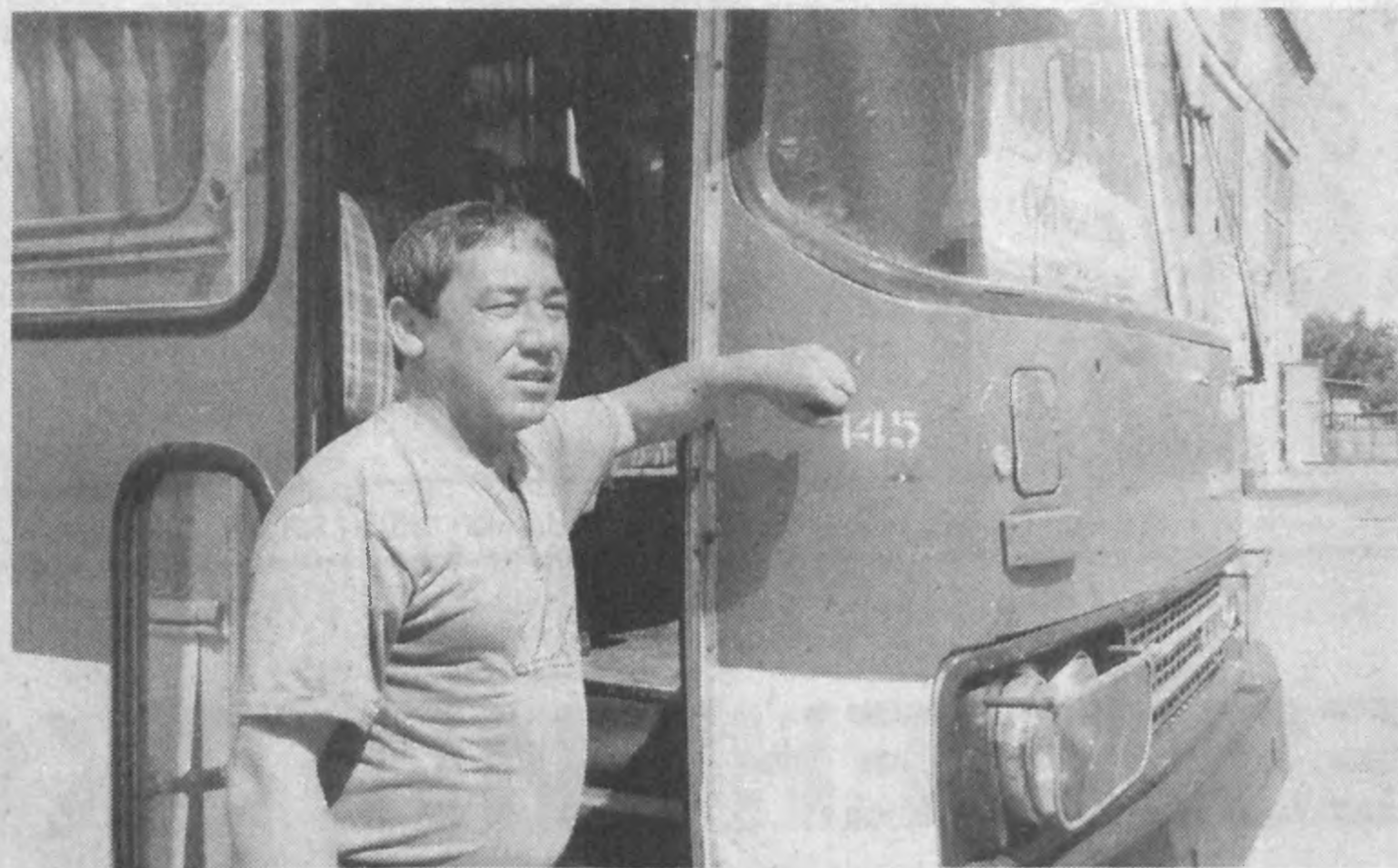
Перед коллективом ОАО "Алматык автобус-таксомотор саройи" главной задачей всегда определялась одна — своевременно и качественно осуществлять пассажирские перевозки.