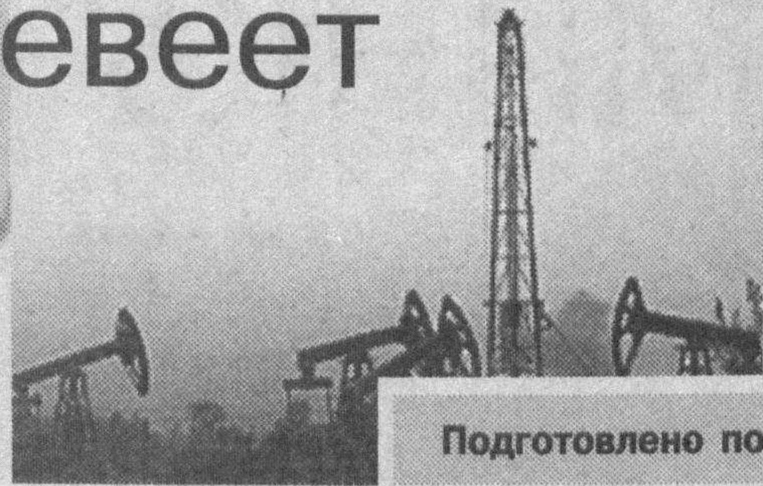
Подготовлено по материалам зарубежных СМИ.

В четверг в Мекке обрушилось четырехэтажное здание, где разместились совершающие хадж паломники. По последним данным, в результате обрушения погибло, по меньшей мере, 23 человека, еще около 60 получили ранения. Об этом сообщает катарский телеканал "Аль-Джазира".