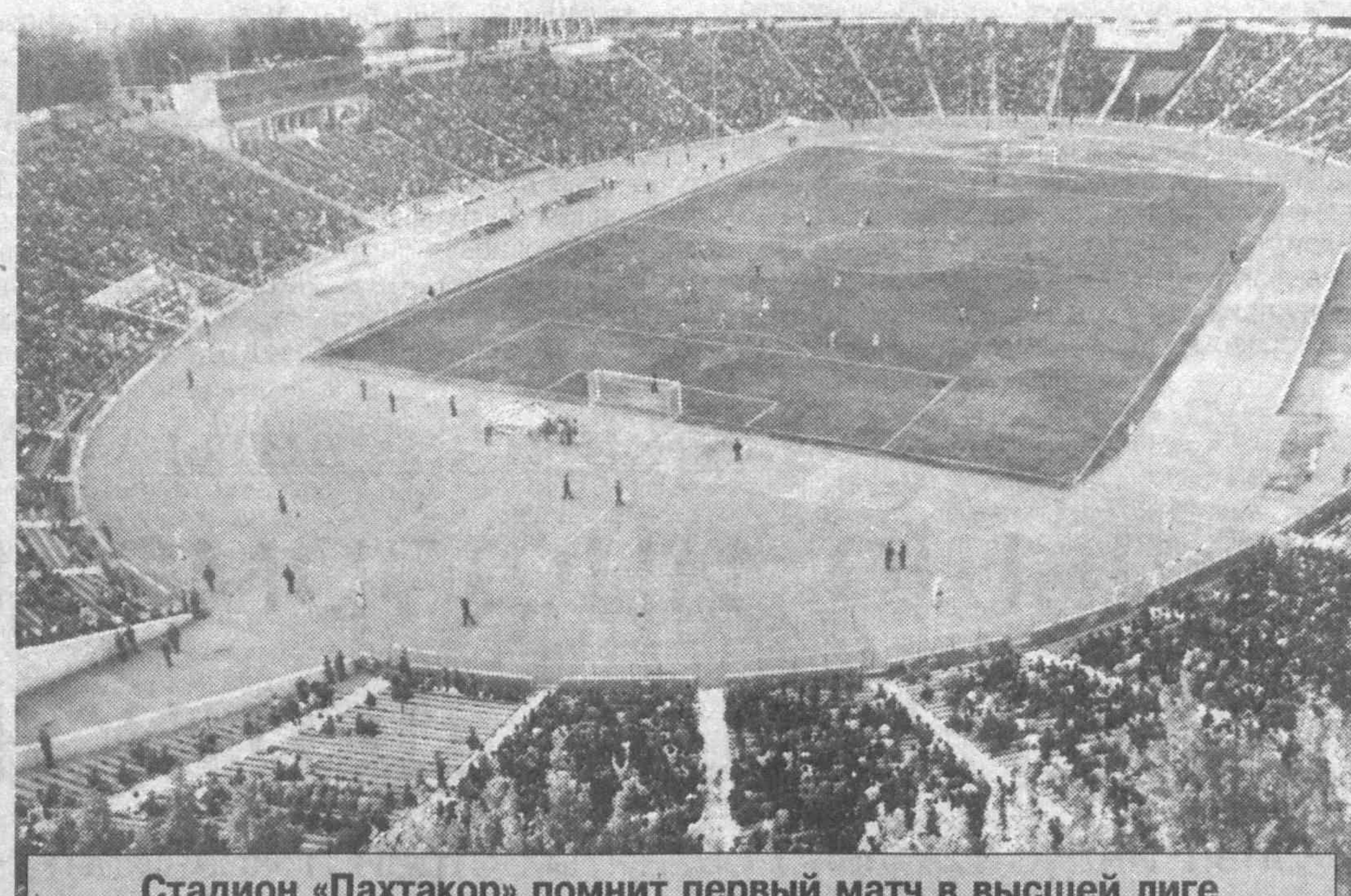
Стадион «Пактакор» помнит первый матч в высшей лиге 9 апреля 1960 года, в котором хозяева встретились с московским «Торпедо». 13 мая была одержана и первая победа «Пактакором» в высшей лиге.

В 1966 году специалисты треста «Главташкентстрой» совместно с венгерской фирмой «Виллес» установили на «Пактакоре» табло, которое было изготовлено венгерской фир-