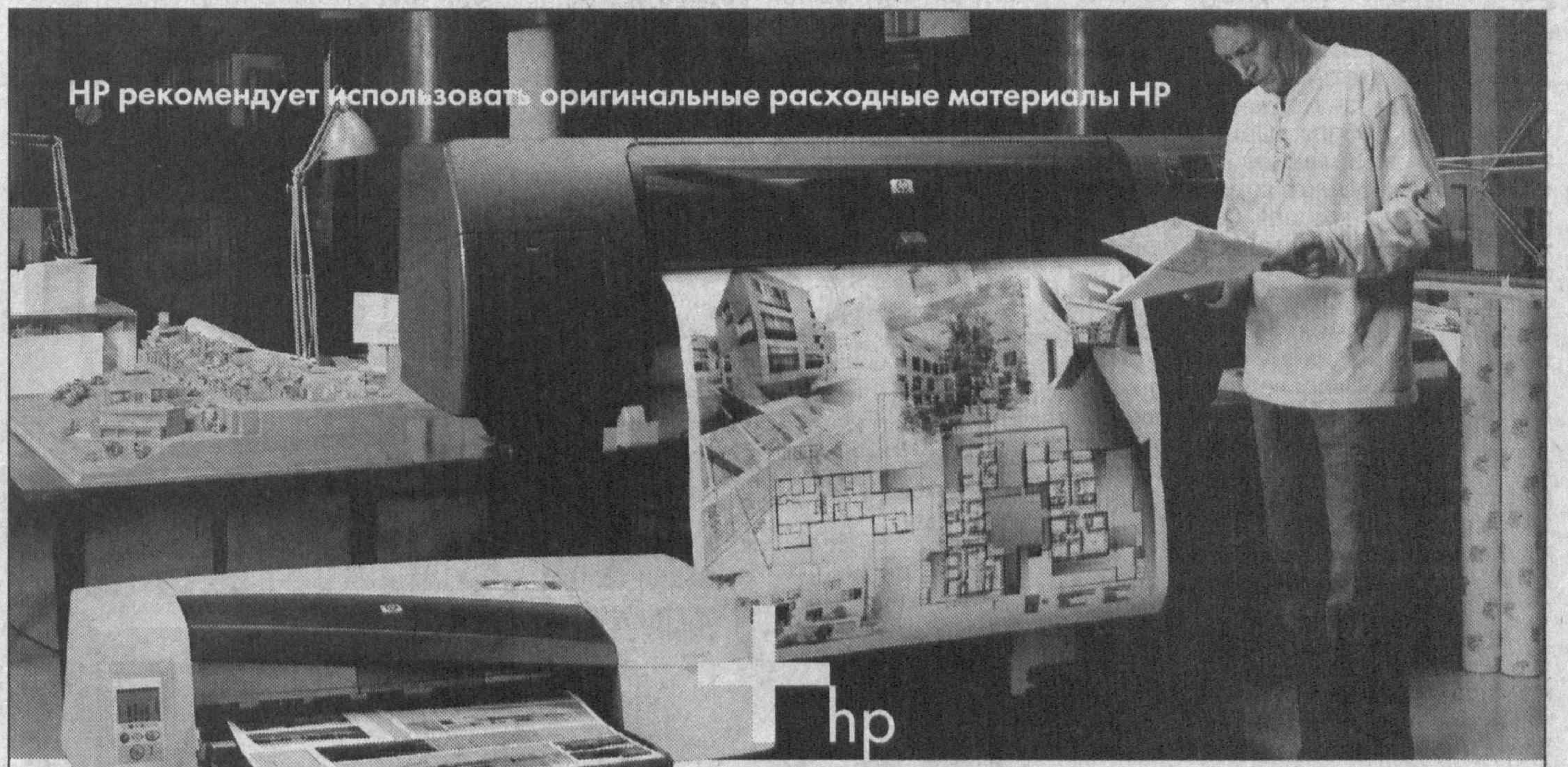
HP рекомендует использовать оригинальные расходные материалы HP

Владислав НОВИЦКИЙ, наш соб. корр. Каракалпакстан