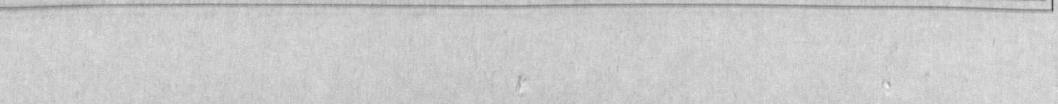
НА СНИМКАХ: один из остановочных пунктов, которых немало на железных дорогах Узбекистана; так выглядит станция Китаб, расположенная в Кашкадарьинской области.