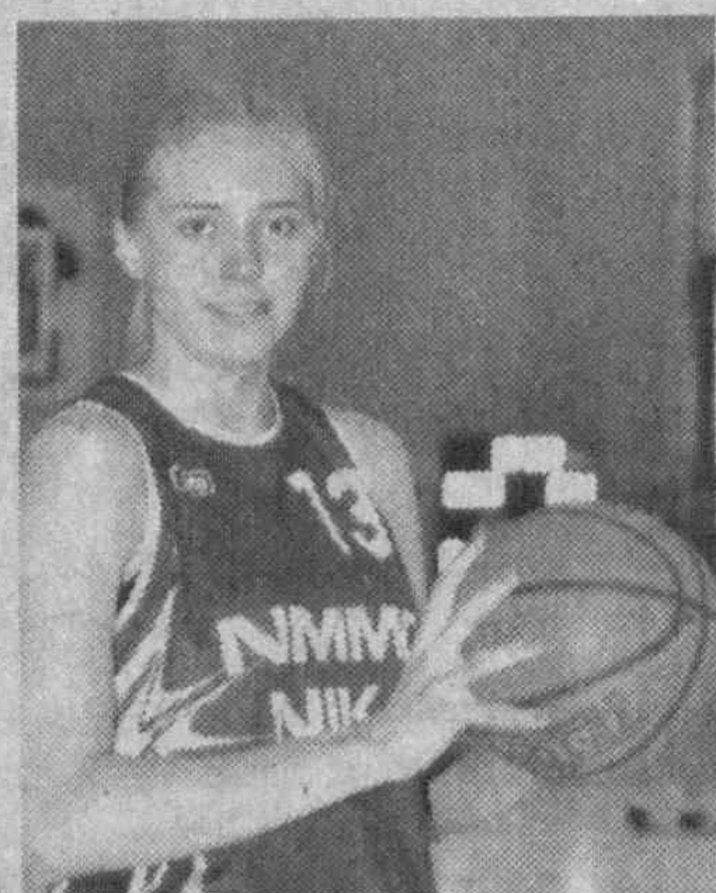
Однако с самого начала сезона лидерство захватили команды «НИКА-1» и «НИКА-2» Навоийского горно-металлургического комбината и до конца шли первыми, превосходя

Во Дворце спорта физкультурно-спортивного комплекса «Согдиана» города Навои завершился розыгрыш чемпионата Узбекистана среди женских баскетбольных клубов Высшей лиги, который собрал девять сильнейших команд.