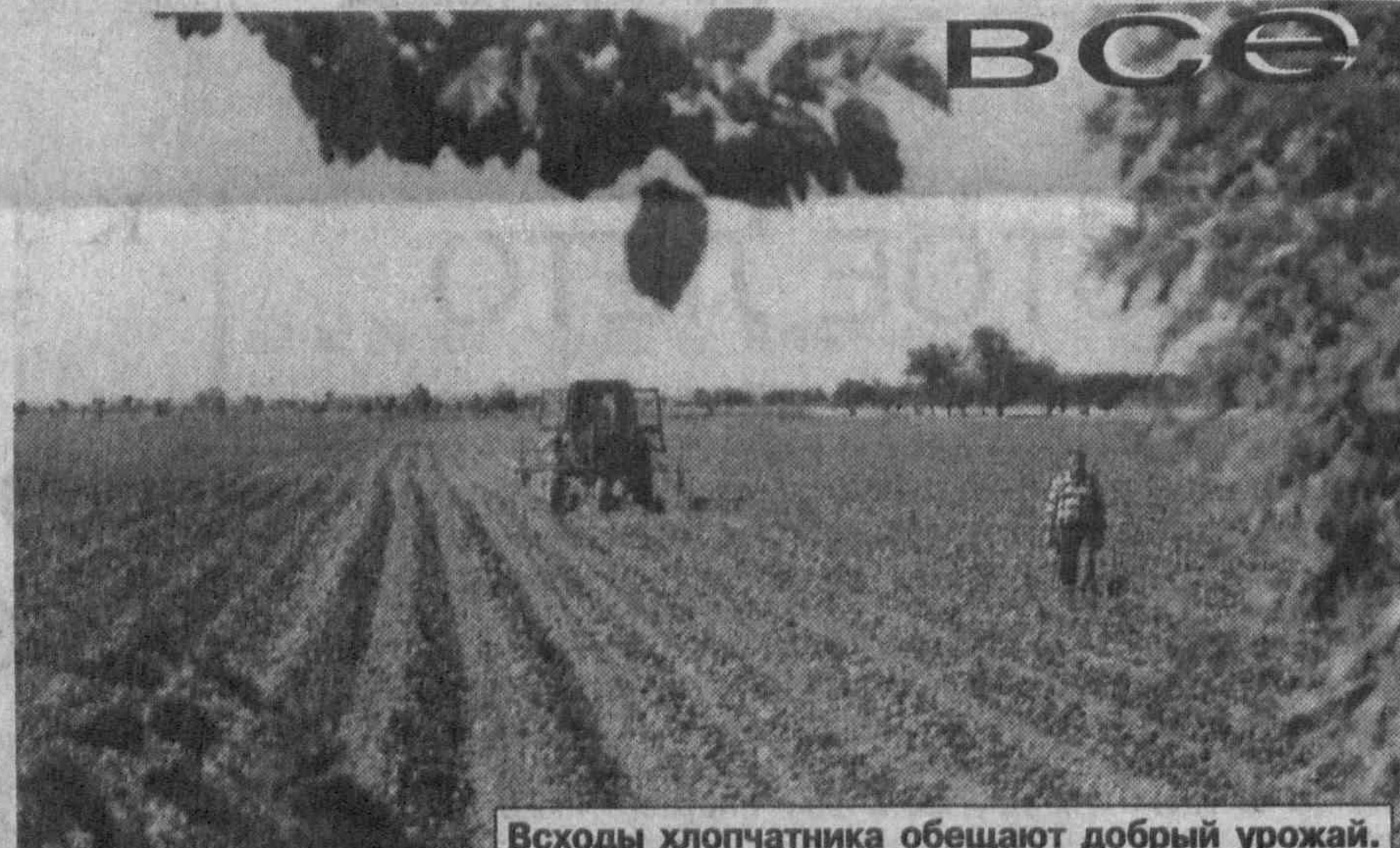
Всходы хлопчатника обещают добрый урожай.

Семеноводческая лаборатория имени Яхши Омонова занимает в Каршинском районе лидирующие позиции по производству семенного материала, поставляемого в земледельческие хозяйства не только района, но и области.