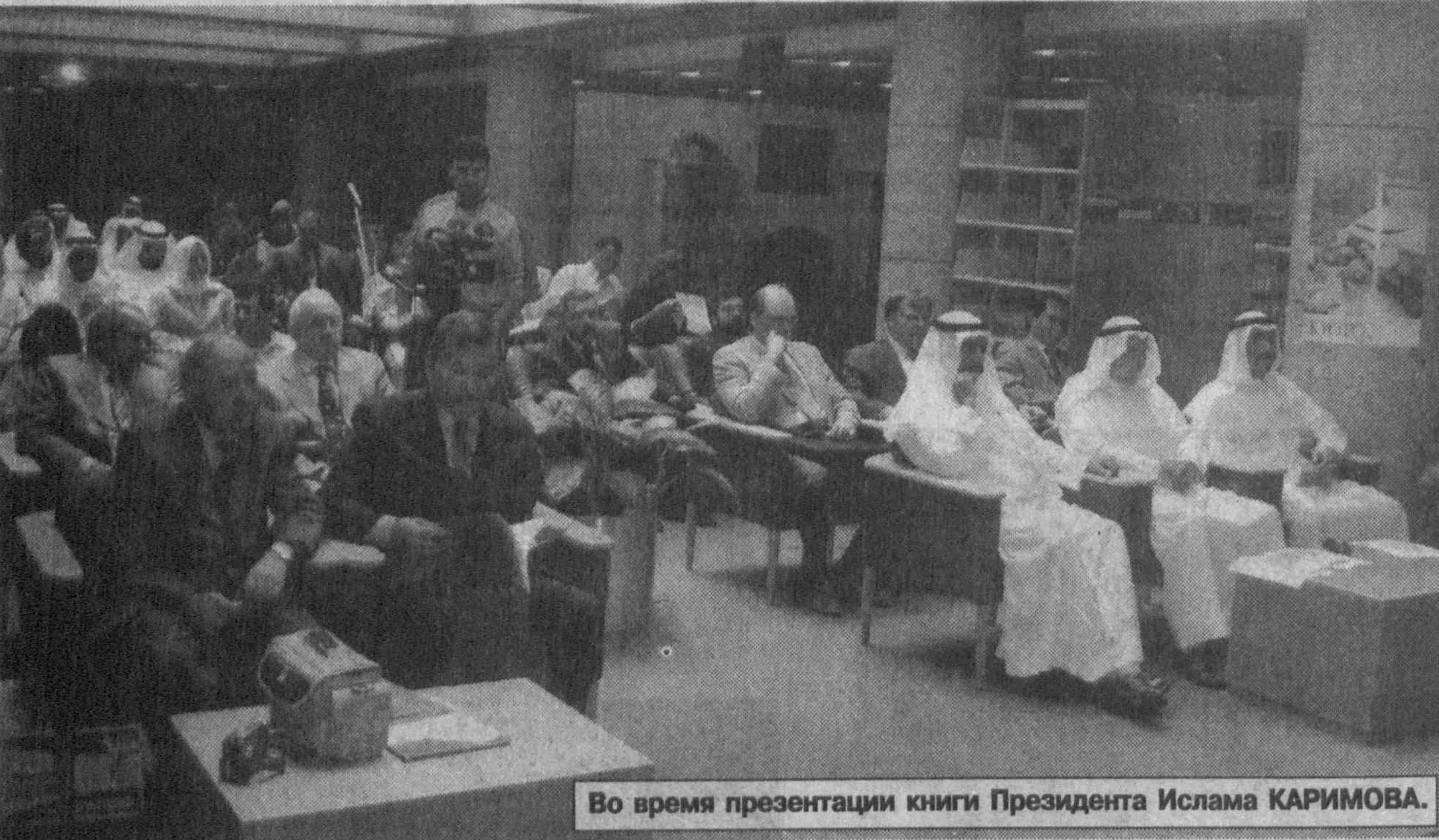
Во время презентации книги Президента Ислама КАРИМОВА.