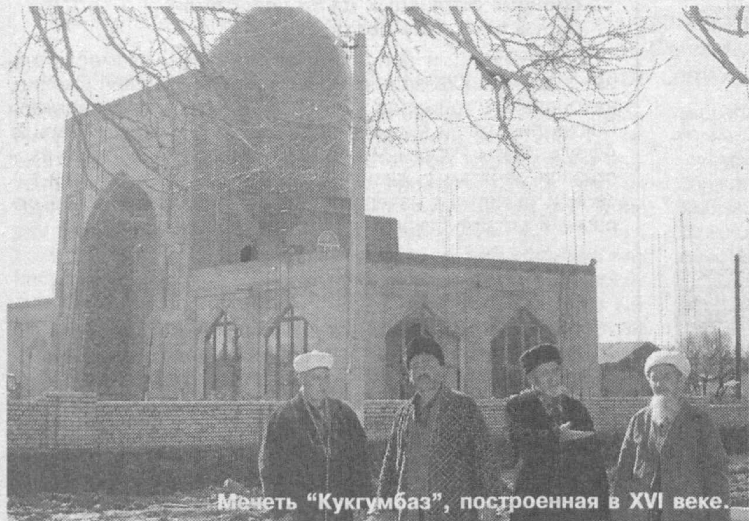
Мечеть "Кукгумбаз", построенная в XVI веке.