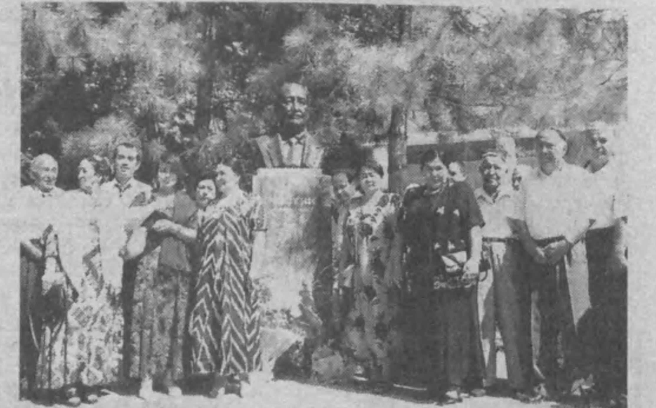
Участники юбилейных мероприятий у памятника Чусты.