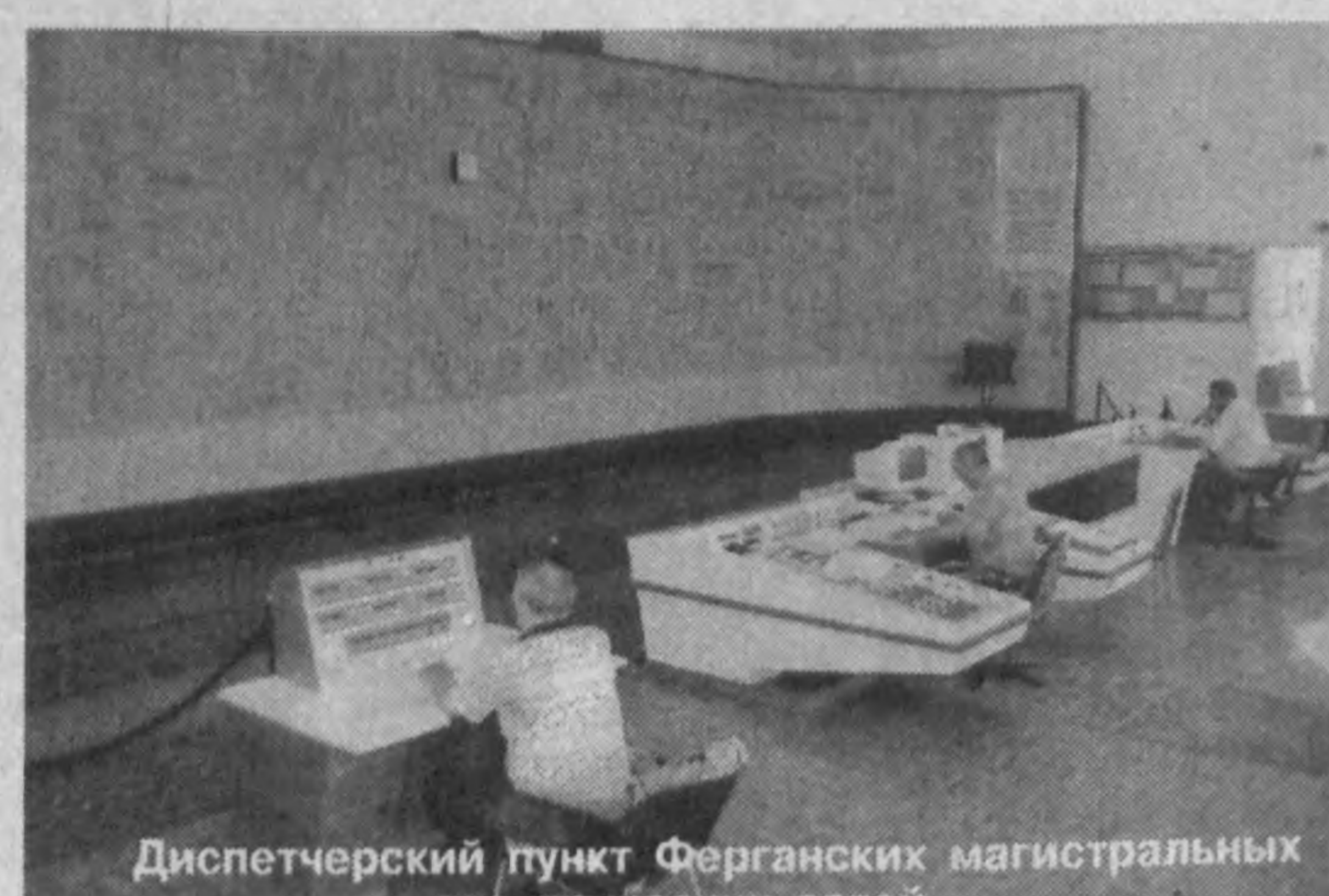
Диспетчерский пункт Ферганских магистральных электрических сетей.