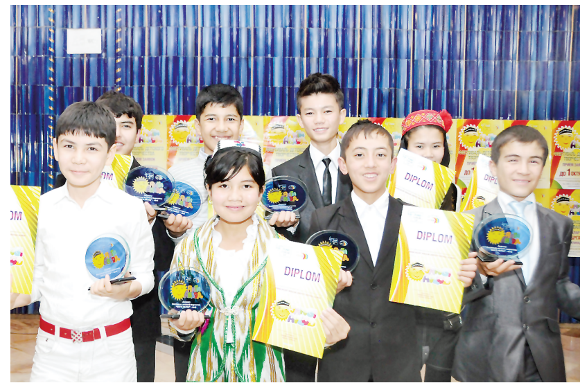
Тадбирда «Янги авлод — 2012» болалар ижодиёти фестивали ғолибларига махсус диплом ҳамда эсдалик совғалари топширилди. Шундан сўнг санъат усталари ва фестиваль ғолиблари иштирокидаги якуний гала-концерт намойиш этилди.