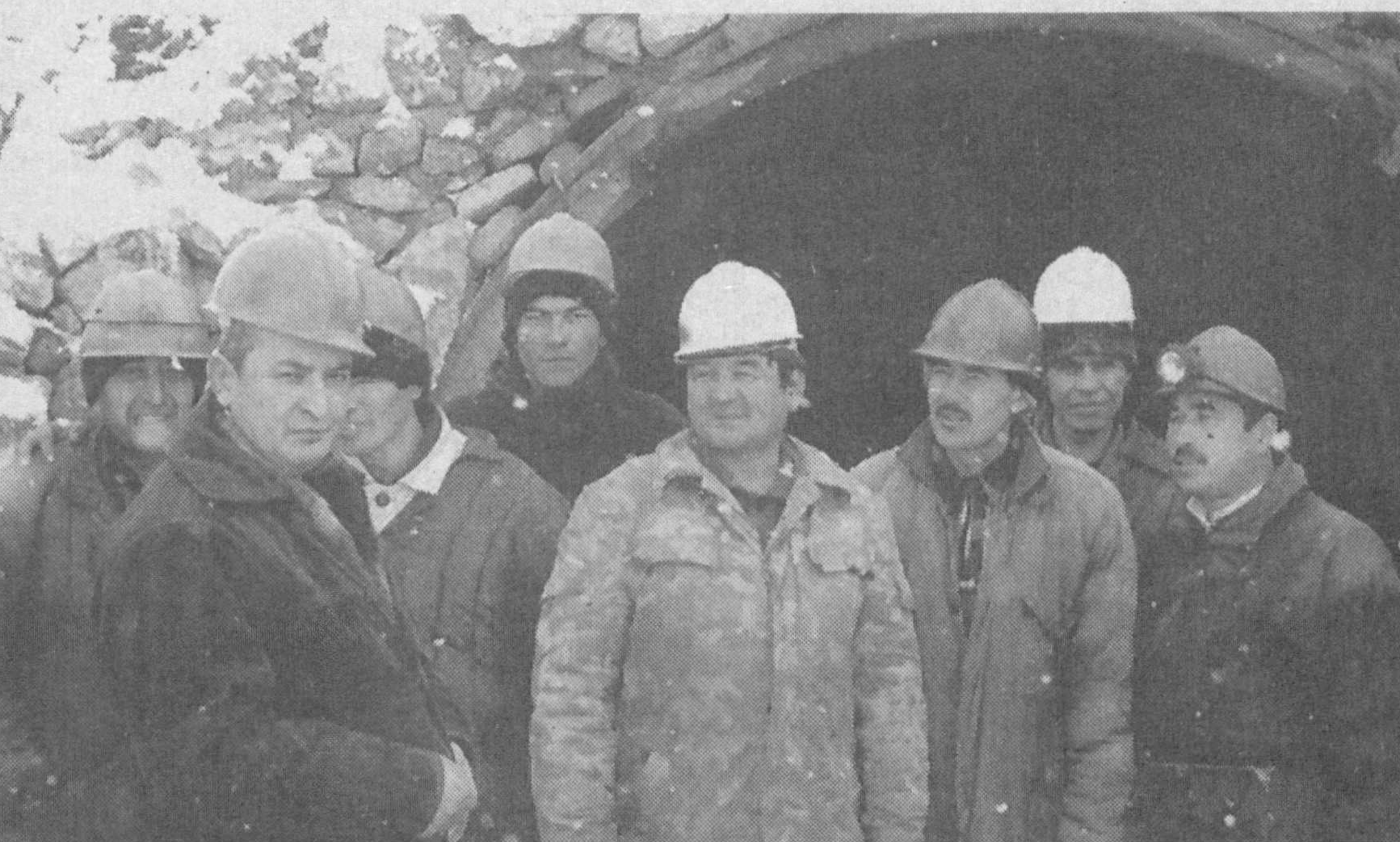
На месторождении Лолабулук.

Геолого-изыскательская экспедиция "Кашкадаря" геологического управления "Самарканд" — одно из старейших предприятий Кашкадарьинской области с почти шестидесятилетней историей. Экспедиция разместились в Шахрисабзе, точнее за перевалом Тахтакорача.