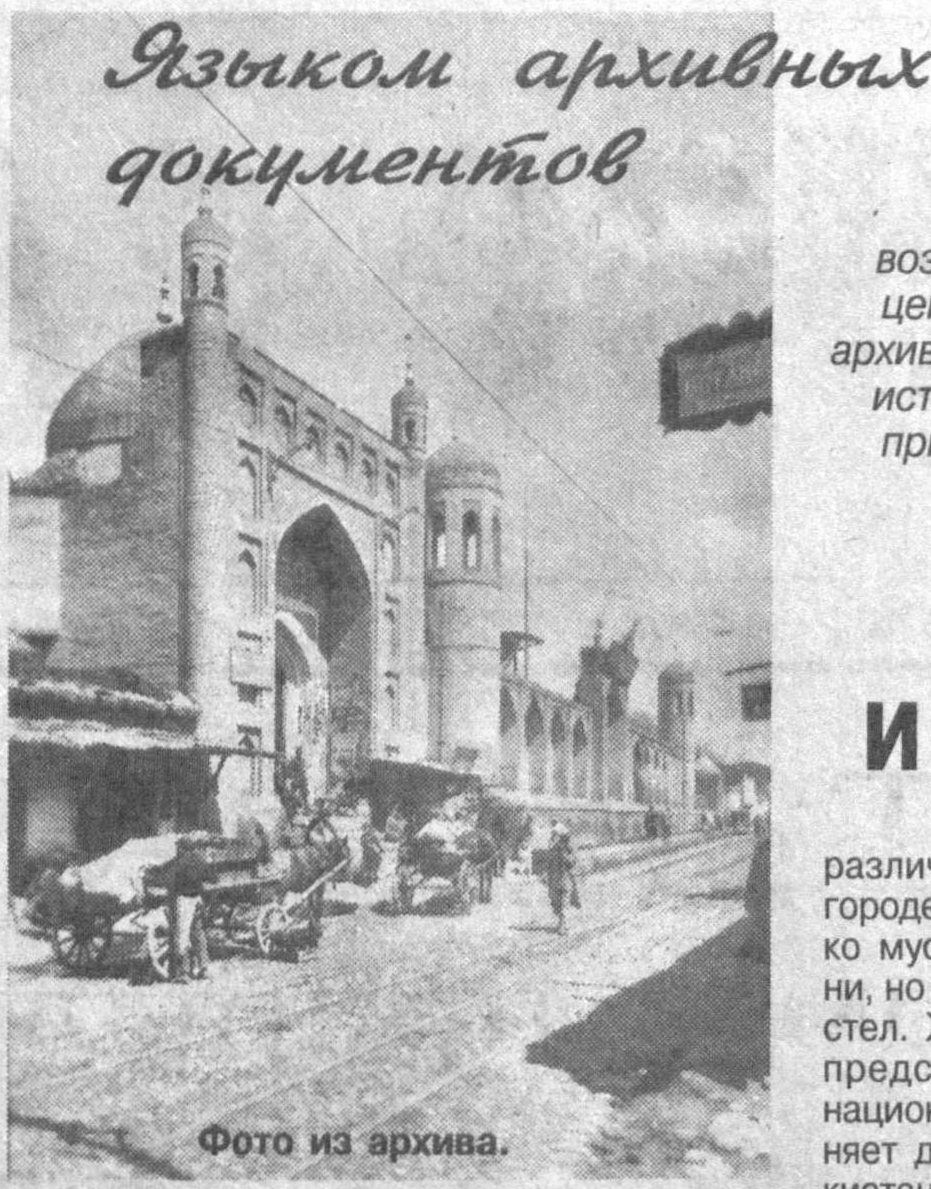
Языком архивных документов

15 апреля для архивистов Узбекистана дата особая. В этот день в 1999 году был принят Закон Республики Узбекистан «Об архивах». Первый закон, регулирующий архивное дело в стране, правовые отношения, возникающие при сборе, хранении и использовании ценных документальных материалов. Согласно ему, архивные документы, являющиеся неотъемлемой частью историко-культурного наследия страны, официально приобрели статус Национального архивного фонда Республики Узбекистан.