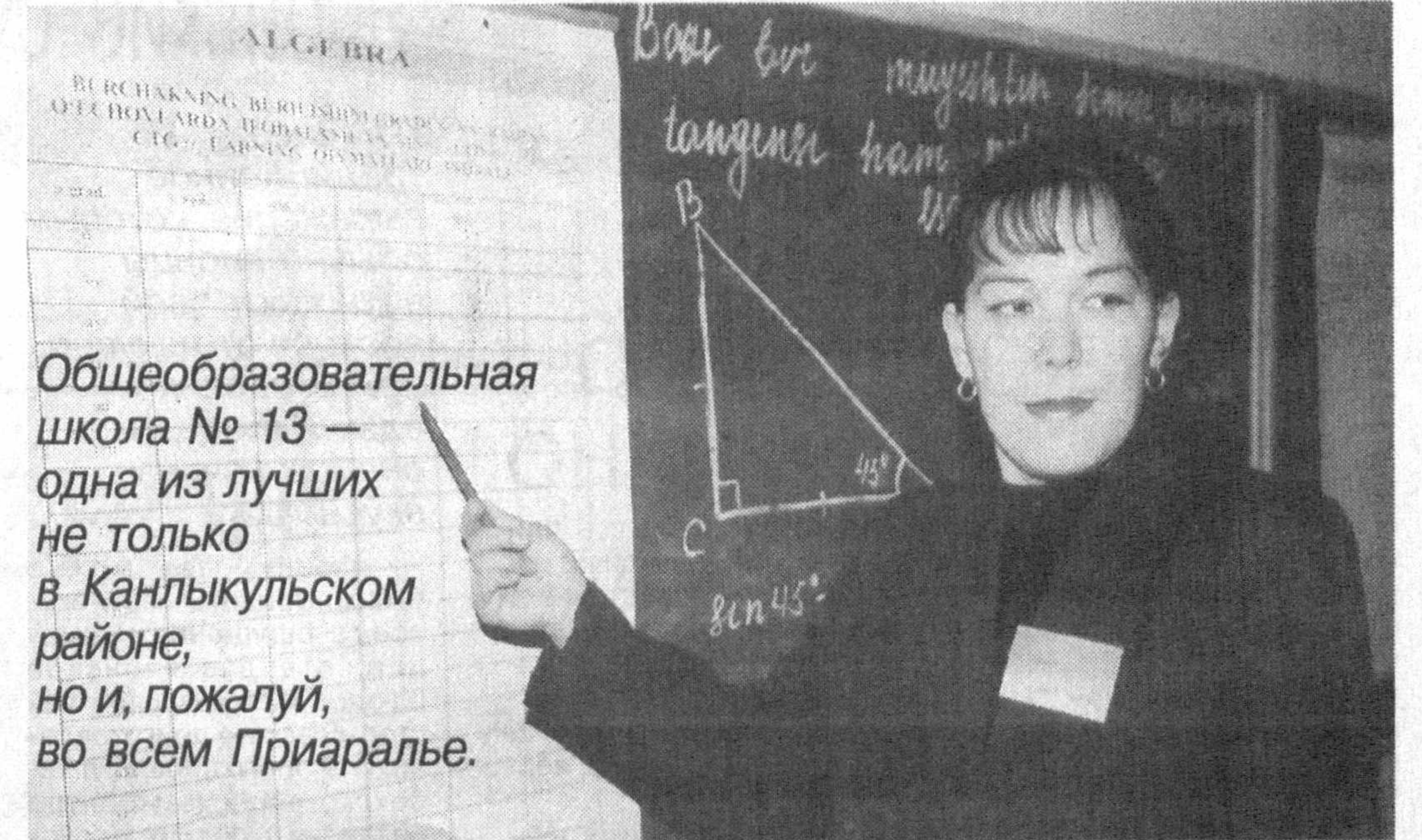
Общеобразовательная школа № 13 — одна из лучших не только в Канлыккульском районе, но и, пожалуй, во всем Приаралье.

В русле реализации Государственной образовательной программы развития школьного образования к началу текущего учебного года школу капитально отремонтировали, обновили мебель, оборудование предметных кабинетов и лабораторий. По словам педагогов, учеников и их родителей, в просторных светлых классах обновленной школы возможности для повышения качества образования расширяются. В этом можно убедиться, посетив, к примеру, откры-