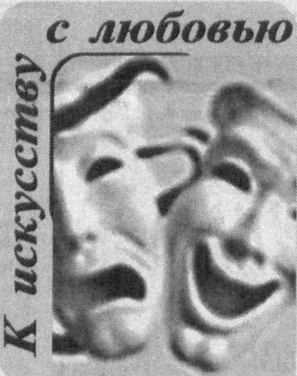
с любовью к искусству

В Термезском областном музыкально-драматическом театре имени Маннона Уйгура готовятся сразу два спектакля: «Красное яблоко» Эркина Хушвактова и «Кирра бобо» Холика Хурсандова. И хотя сюжеты в них разные, есть нечто общее, что их объединяет. В обоих воспеваются важные общечеловеческие ценности — доброта души, терпимость, верность, совесть и честь.