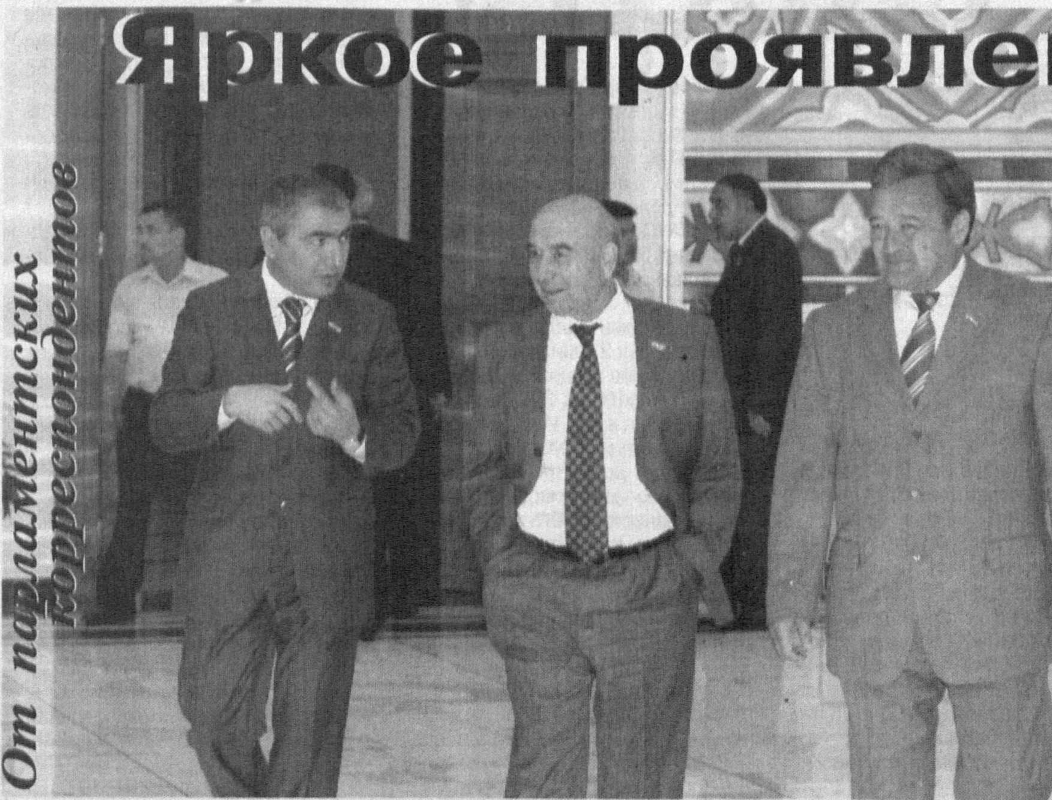
От парламентских корреспондентов