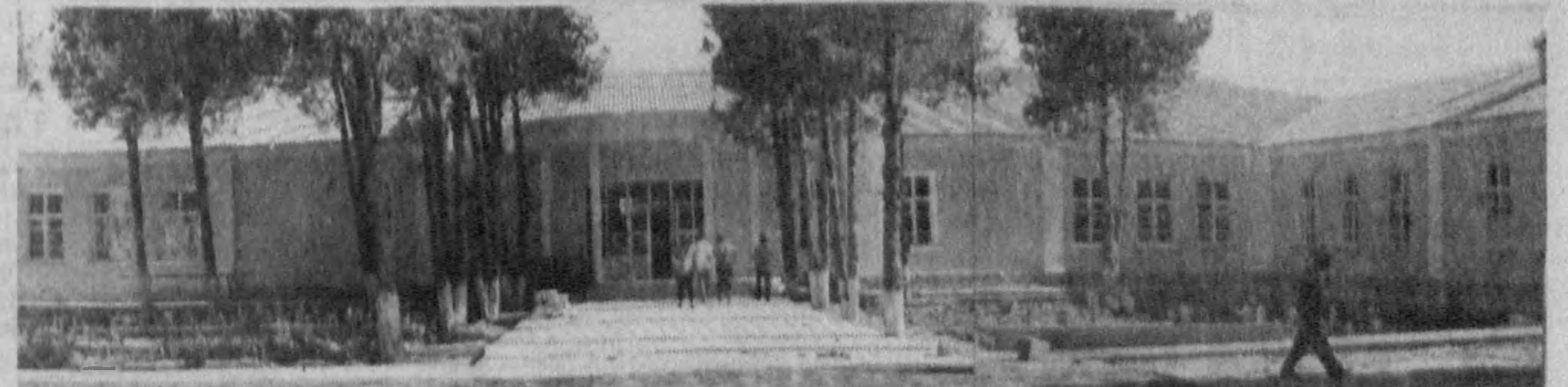
Полоса подготовлена собственным корреспондентом Рустамом БАБАМУРАТОВЫМ.

В нынешнем году на 3,5 тысячи гектаров поляных земель Булунгурского, Тайлакского и Самаркандского районов выращивается весьма богатая белками бобовая культура — соя. На 6,5 тысячи гектаров, освобожденных от зерновых, уже созревают зерна сафлора-максары.