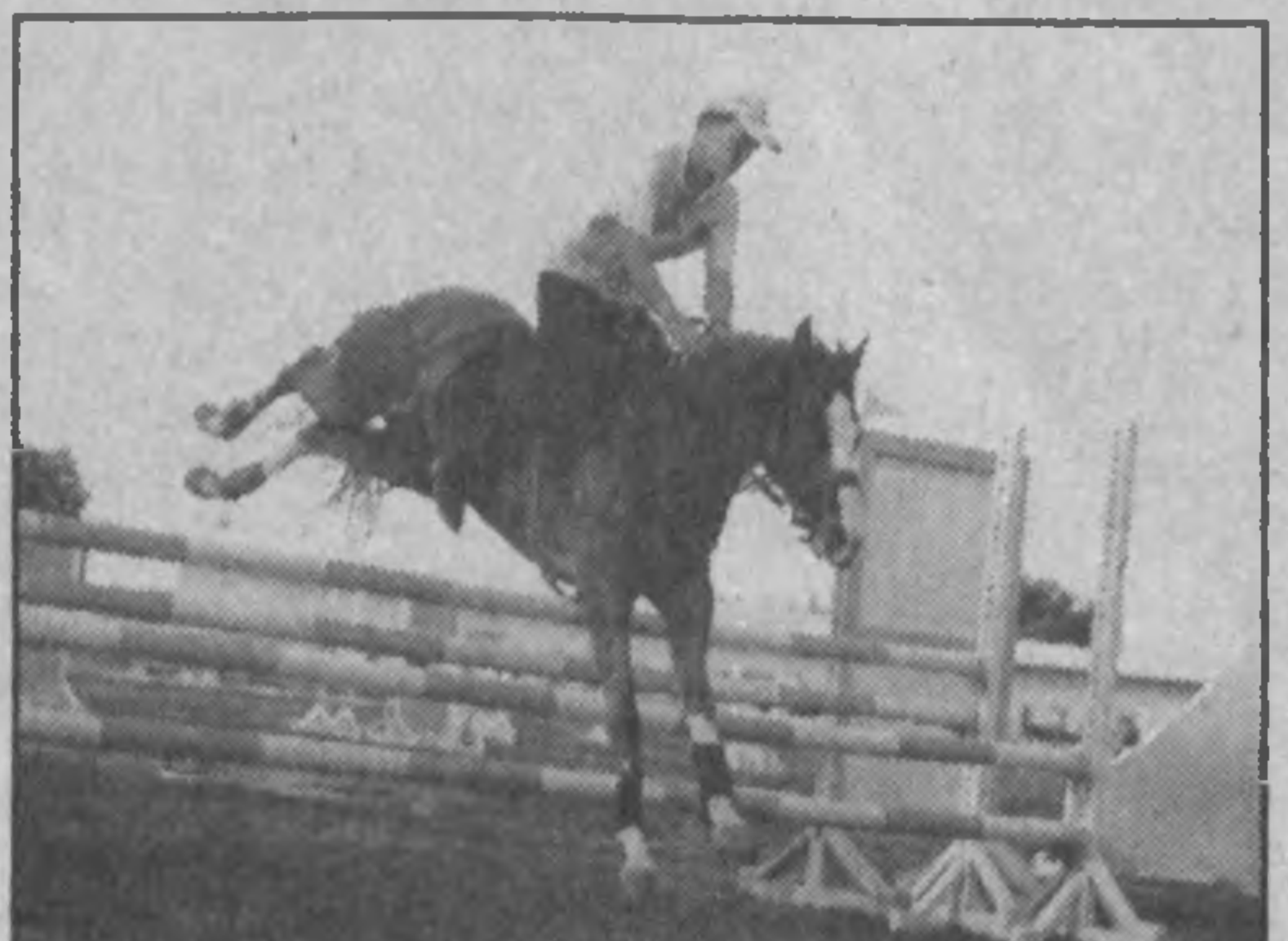
НА СНИМКАХ: так проходят тренировки.