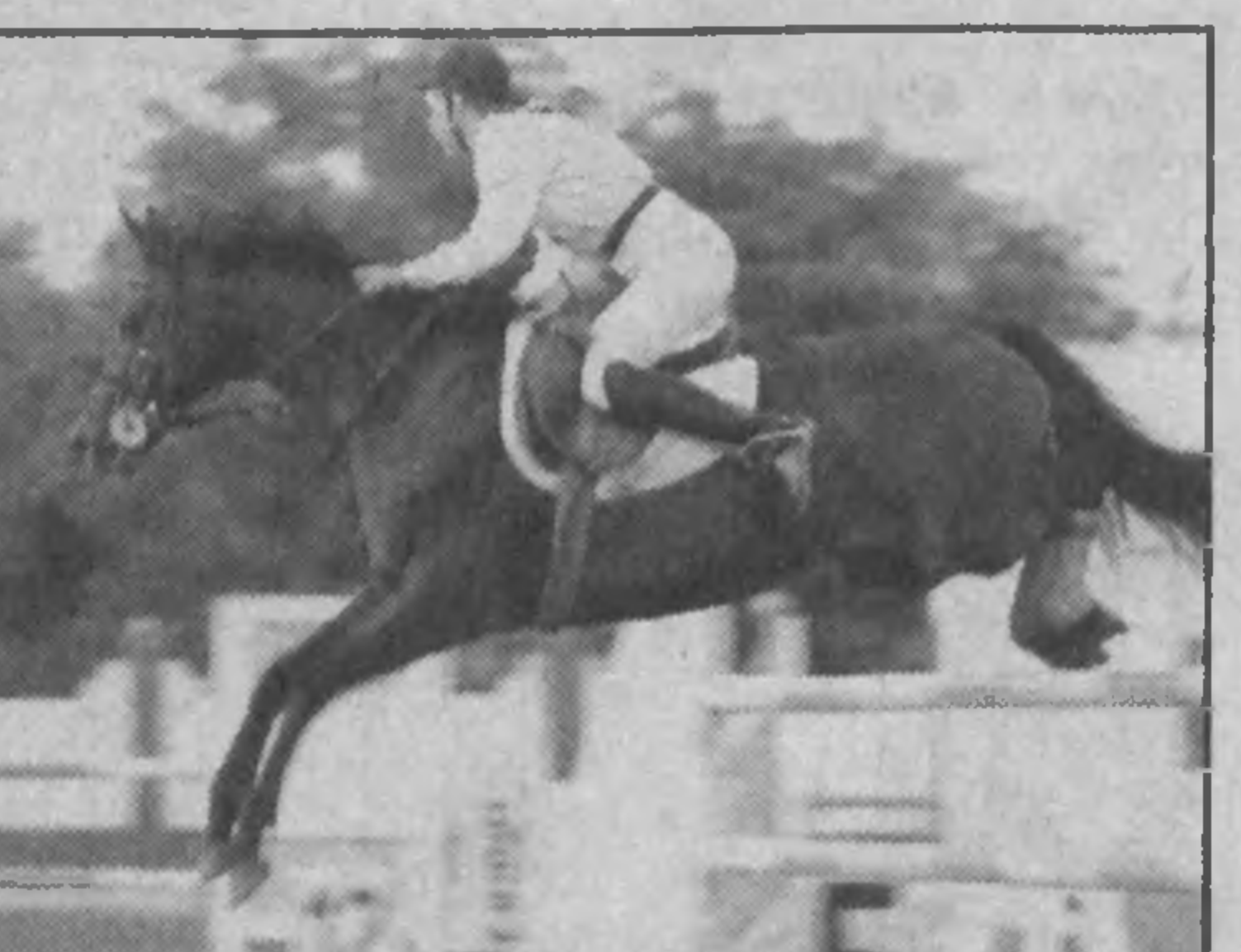
НА СНИМКАХ: так проходят тренировки.