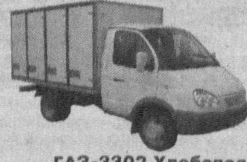
GAZ-3302 Хлебовоз количество лотков - 112 шт., количество мест - 3

E-mail: info@auto.uz, website: www.auto.uz