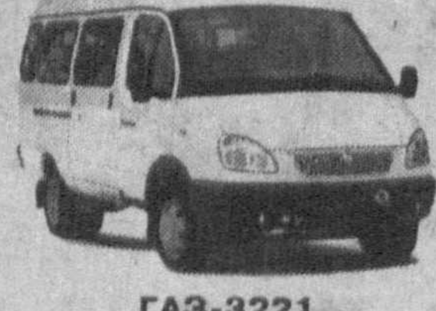
GAZ-3221 Микроавтобус количество пассажирских мест - 15