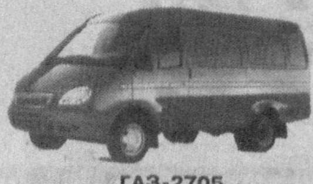
GAZ-2705 Цельнометаллический фургон грузоподъемность - 1,3 т, количество мест - 3 или 7