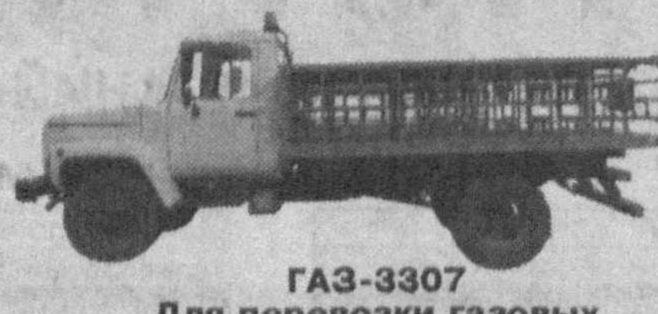
GAZ-3307 Для перевозки газовых баллонов (40 шт.)