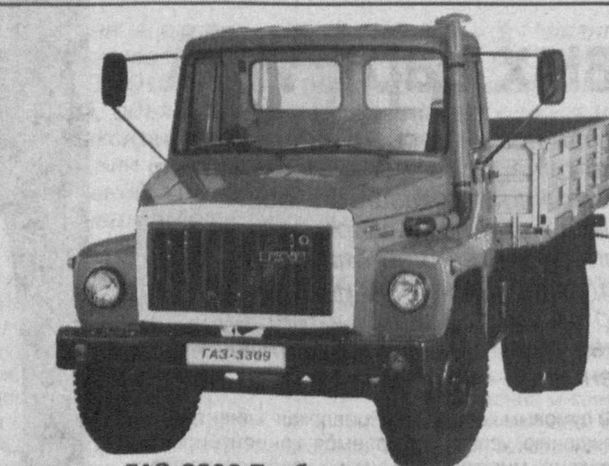
GAZ-3309 Турбодизель грузоподъемность - 4,5 т, количество мест - 2

Республика Узбекистан, 700015, г. Ташкент, ул. Шахрисабз, 16а. Тел./факс: (998-71) 132-12-01, 132-10-36, 132-03-62. Телефоны горячей линии: 126-12-94, 126-26-42.