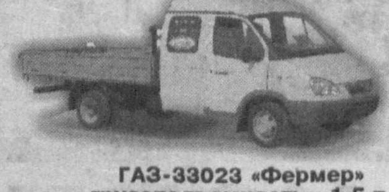
GAZ-33023 «Фермер» грузоподъемность - 1,5 т, количество мест - 6