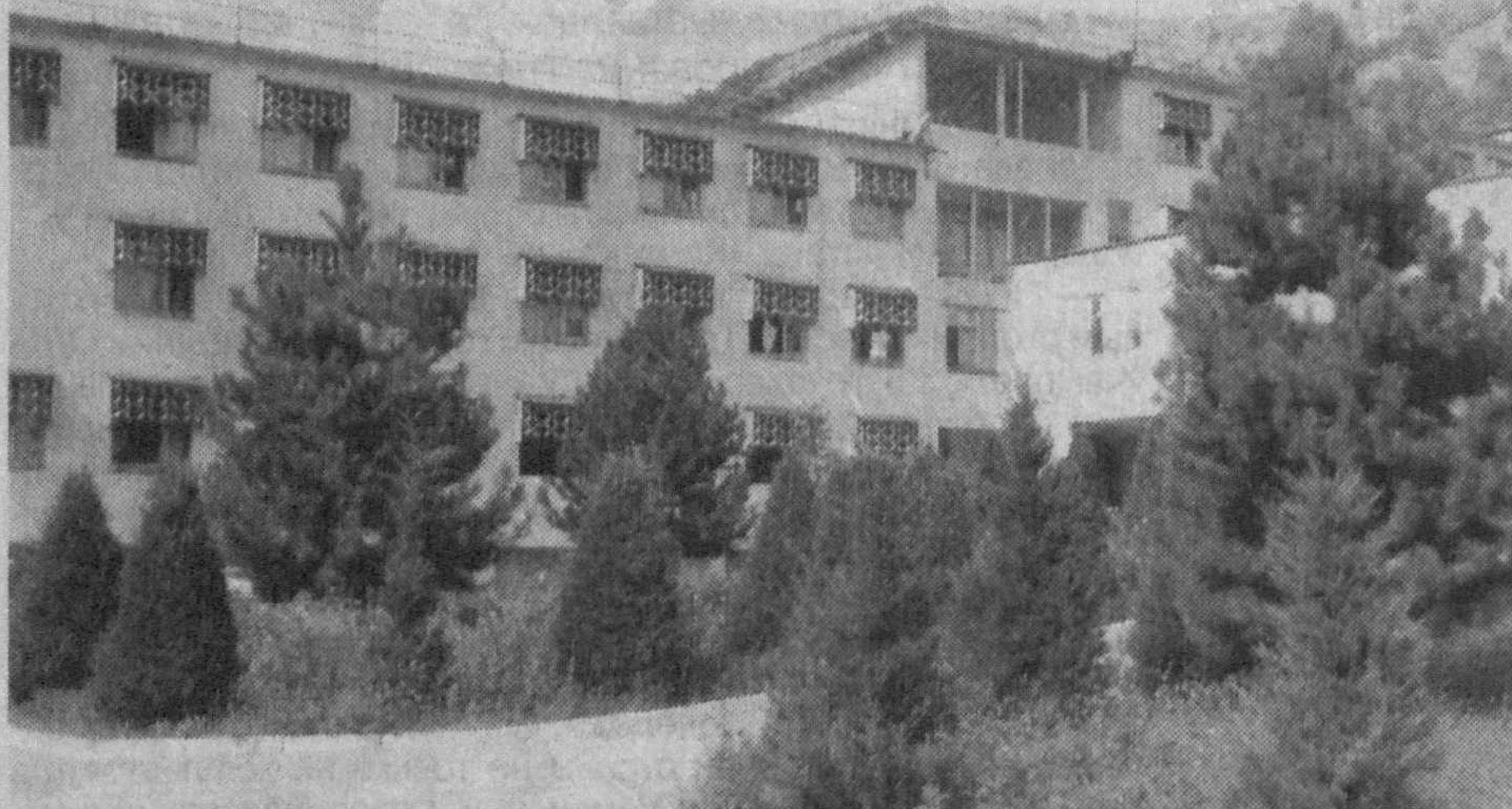
Хорошо в пансионате «Сокол»

Наверное, ничто не действует на человека столь благотворно, как общение с природой. Уже от одного предвкушения встречи с ней замирает сердце. Всего полтора часа езды от шумной столицы, и вы попадаете в совершенно другой мир, где безраздельно царствует дух нетленного величия, где сразу и навсегда ваше воображение покоряет первозданная красота, напоенная звуками и благоуханием живой земли.