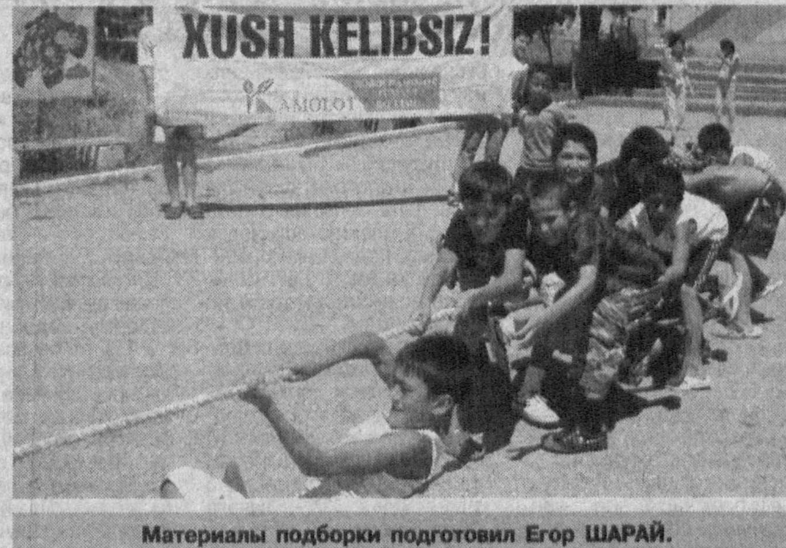
Материалы подборки подготовил Егор ШАРАЙ.