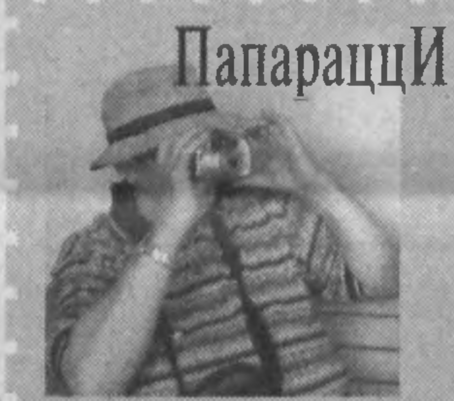
А. ИВАНОВА, корр. УзА.

Во время соревнований в Шахрисабзе проведено заседание Исполнительного комитета Международной ассоциации кураша.