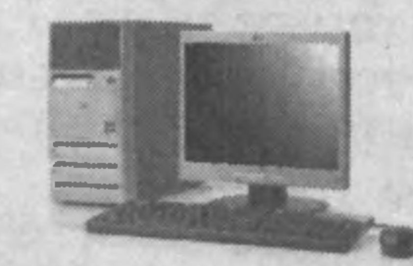
HP COMPAQ BUSINESS DESKTOP dx2000

Настольные компьютеры HP Compaq Business Desktop dx2000, HP Compaq Business Desktop dx6100 Microtower и HP Compaq Business Desktop dc7100 Convertible Minitower — это лучшая профессиональная экипировка Ваших служащих, повышающая производительность труда. Сегодня вы и Ваши сотрудники предъявляют все большие требования к своему настольному компьютеру, так как Вам необходимо реализовывать одновременно несколько задач для большей эффективности в работе. Выберите компьютер, который поможет Вам работать с максимальной отдачей.