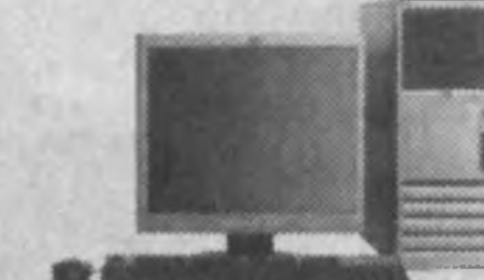
HP COMPAQ BUSINESS DESKTOP dc7100 CONVERTIBLE MINITOWER