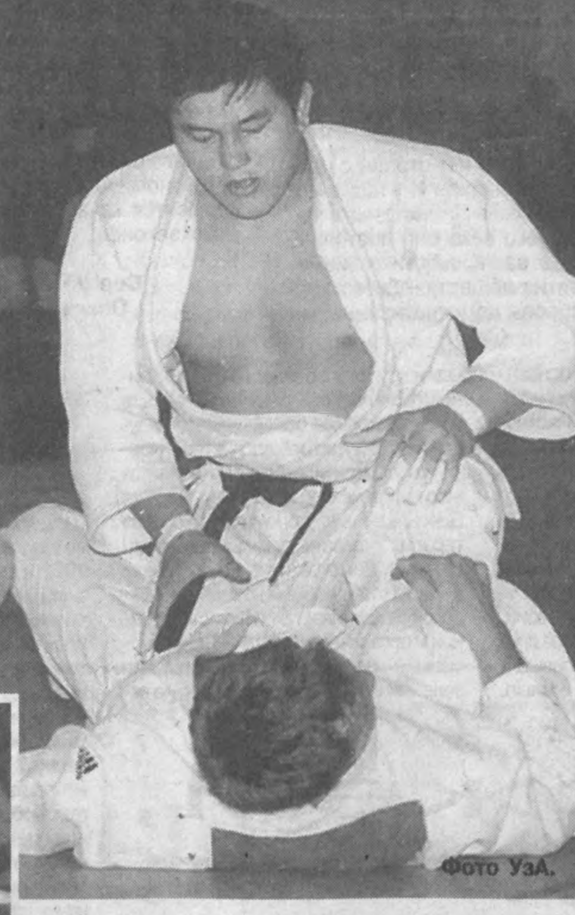
сильный состав у сборных команд Турции, Казахстана, Бразилии и, конечно же, у "хозяйки" этого вида спорта — сборной Узбекистана. Воспитанники чемпиона мира Исока Ахмедова намерены доказать, что кураш на родине Амира Темура особенно почитаем.