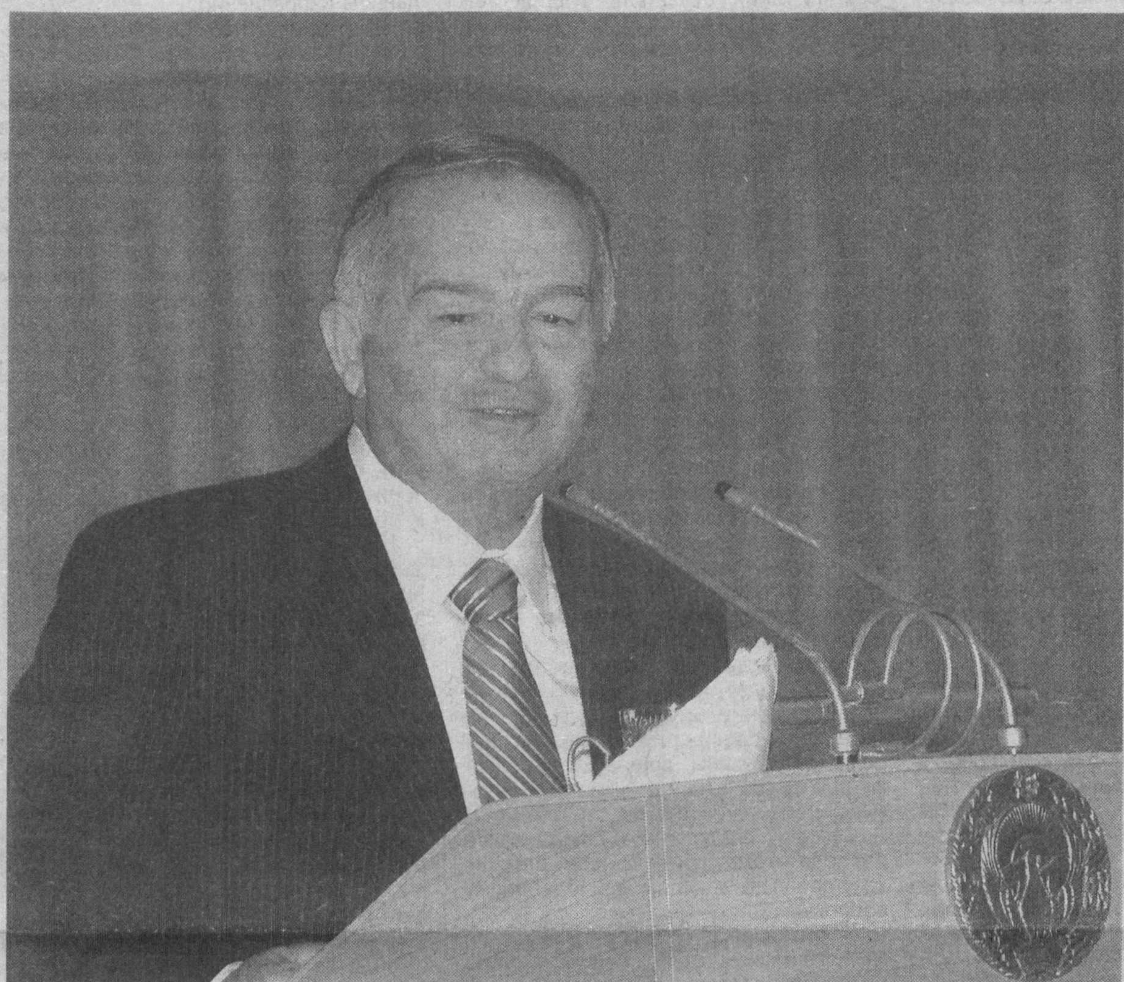
Доклад Президента Ислама Каримова на торжественном заседании, посвященном 14-летию Конституции Республики Узбекистан

В столичном Дворце «Туркистон» 7 декабря состоялось торжественное заседание, посвященное 14-летию со дня принятия Конституции Республики Узбекистан. В нем приняли участие политические и общественные деятели, представители науки, культуры и искусства, общественности, иностранных посольств и представительств международных организаций, аккредитованных в нашей стране.