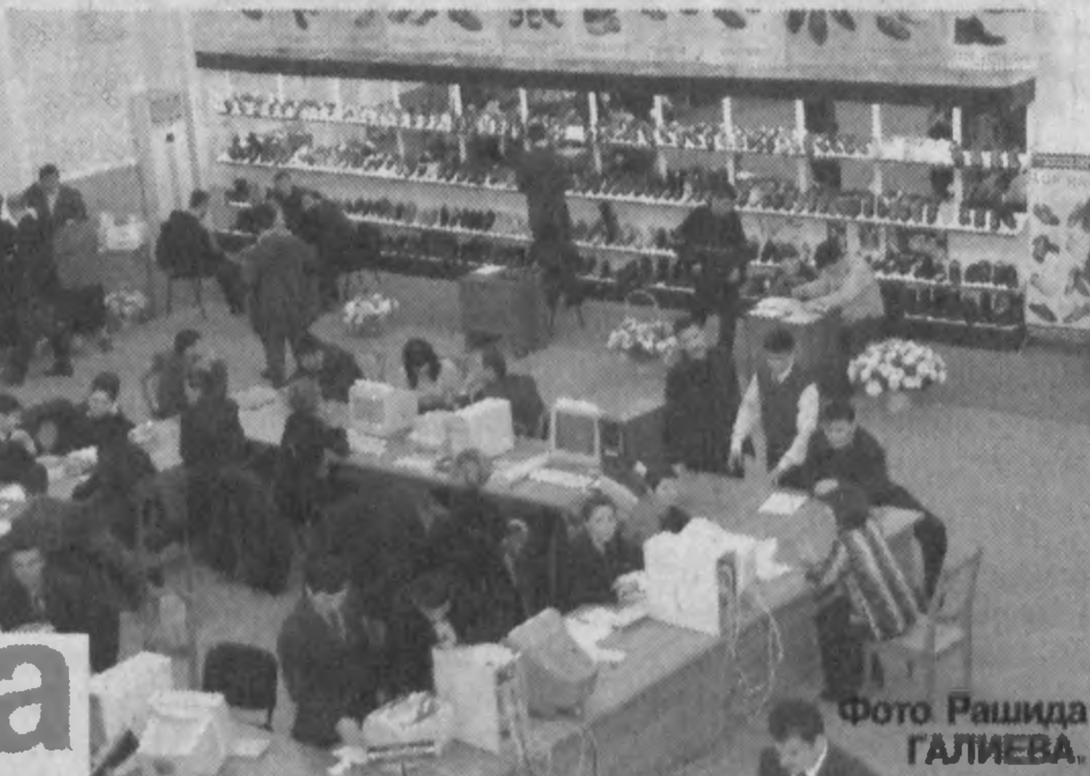
(Окончание на 4-й стр.)