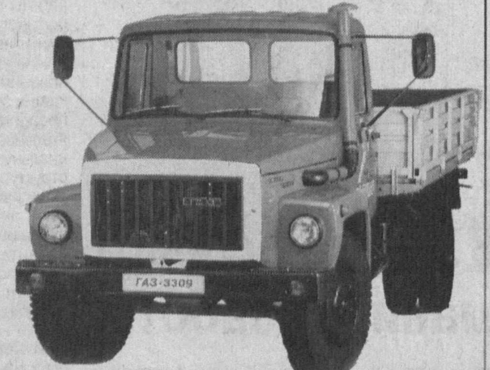
GAZ-3309 Турбодизель грузоподъемность - 4,5 т, количество мест - 2

Республика Узбекистан, 700015, г. Ташкент, ул. Шахрисабз, 16а. Тел./факс: (998-71) 132-12-01, 132-10-35, 132-03-62. Телефоны горячей линии: 126-12-94, 126-25-42.