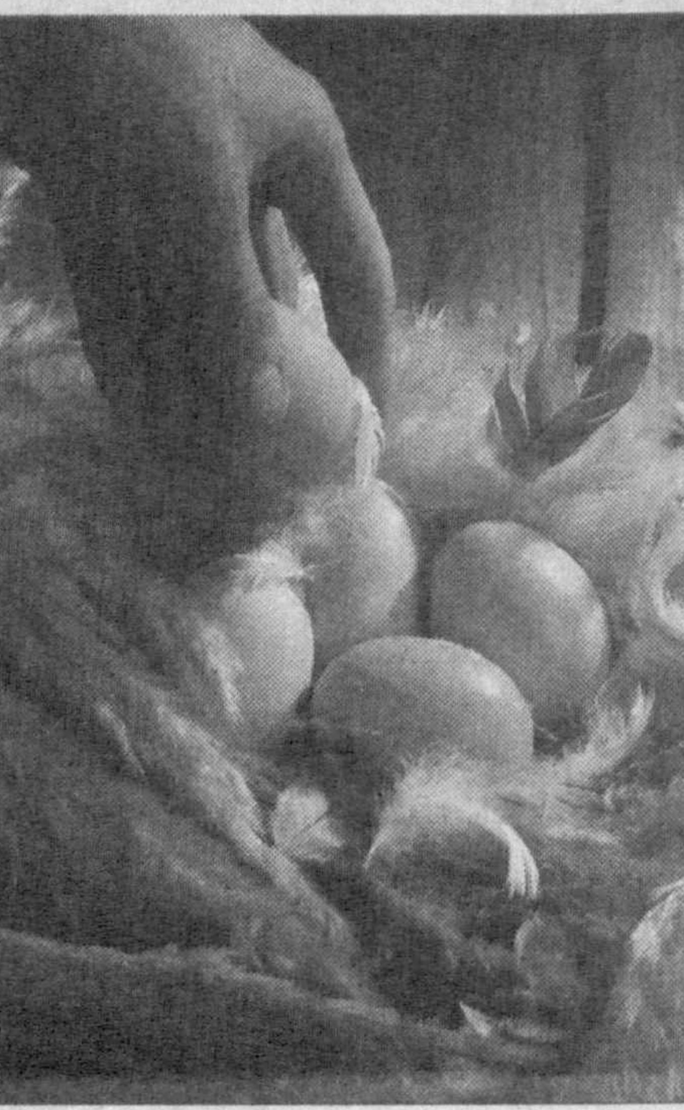
Акимжан АДИЗОВ, наш соб. корр.

Работники управления активно сотрудничают с руководителями схода граждан, махаллинских комитетов и их активистами. С их помощью они стараются доступно объяснить сырдарьинцам, где и как можно взять льготный кредит, куда обратиться с вопросами, связанными с приобретением пти-