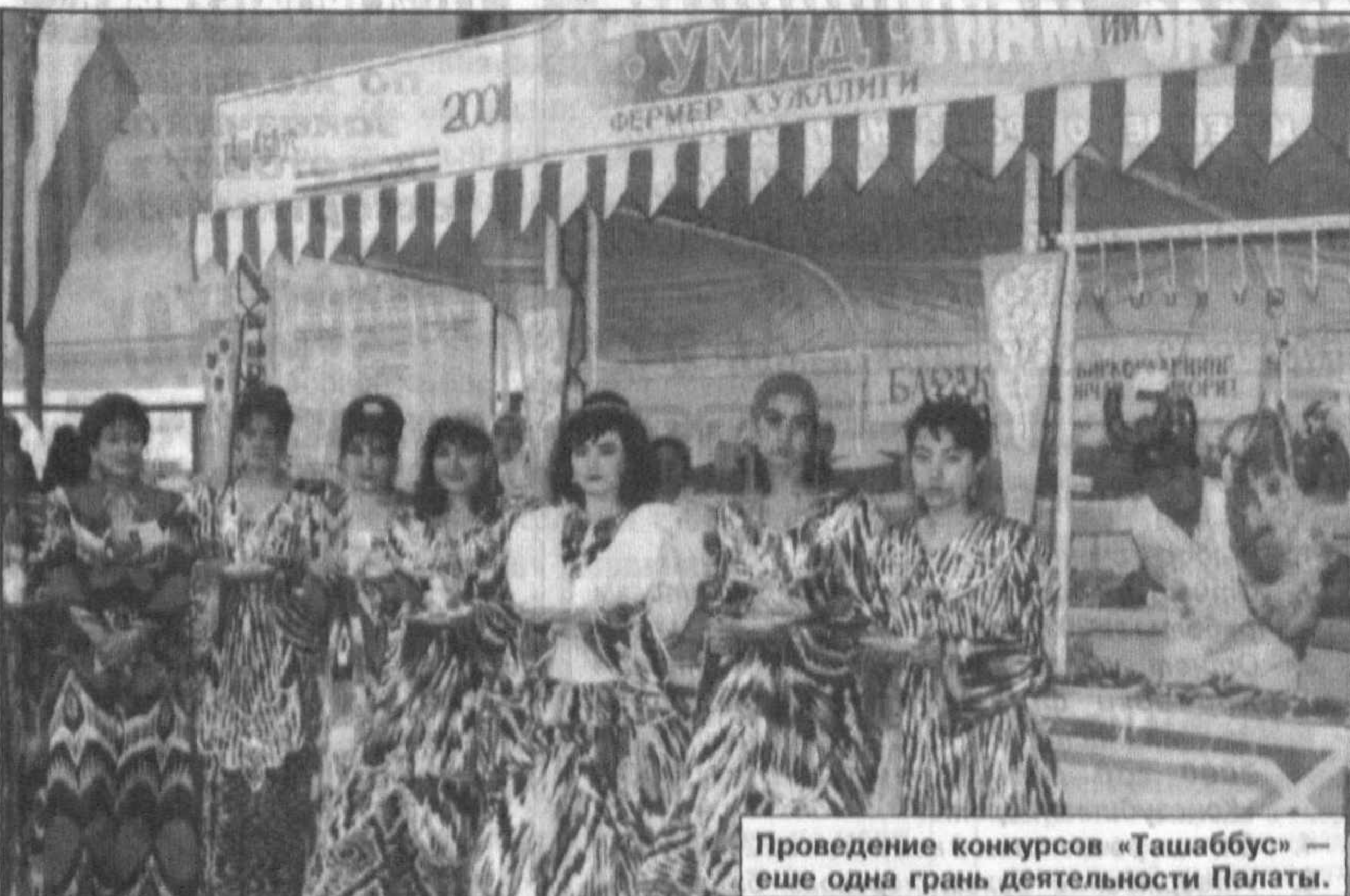
Проведение конкурсов «Ташаббус» — еще одна грань деятельности Палаты.

Развитие экспорта товаров и услуг, оказание помощи субъектам МСБ в проведении операций на внешнем рынке и освоение ими новых форм экономического сотрудничества, организация международных выставок и ярмарок — это также одна из задач, которую призвана решать Палата товаропроиз-