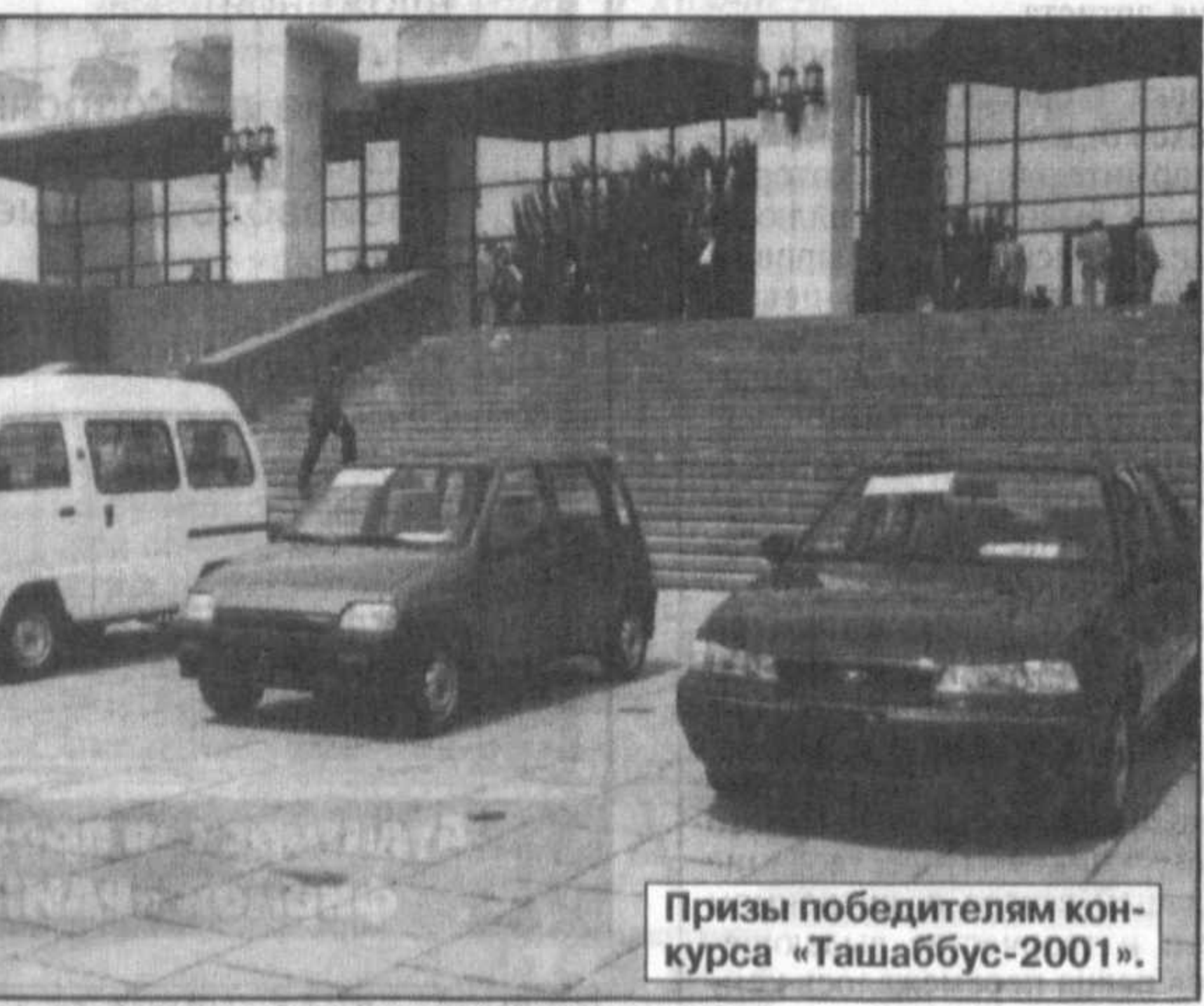
Призы победителям конкурса «Ташаббус-2001».