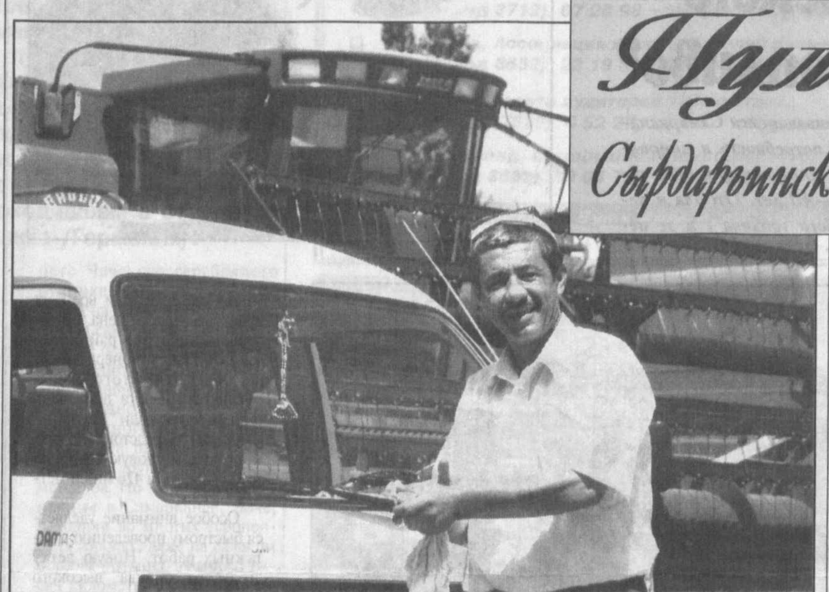
Дуло Сурдарьинской области