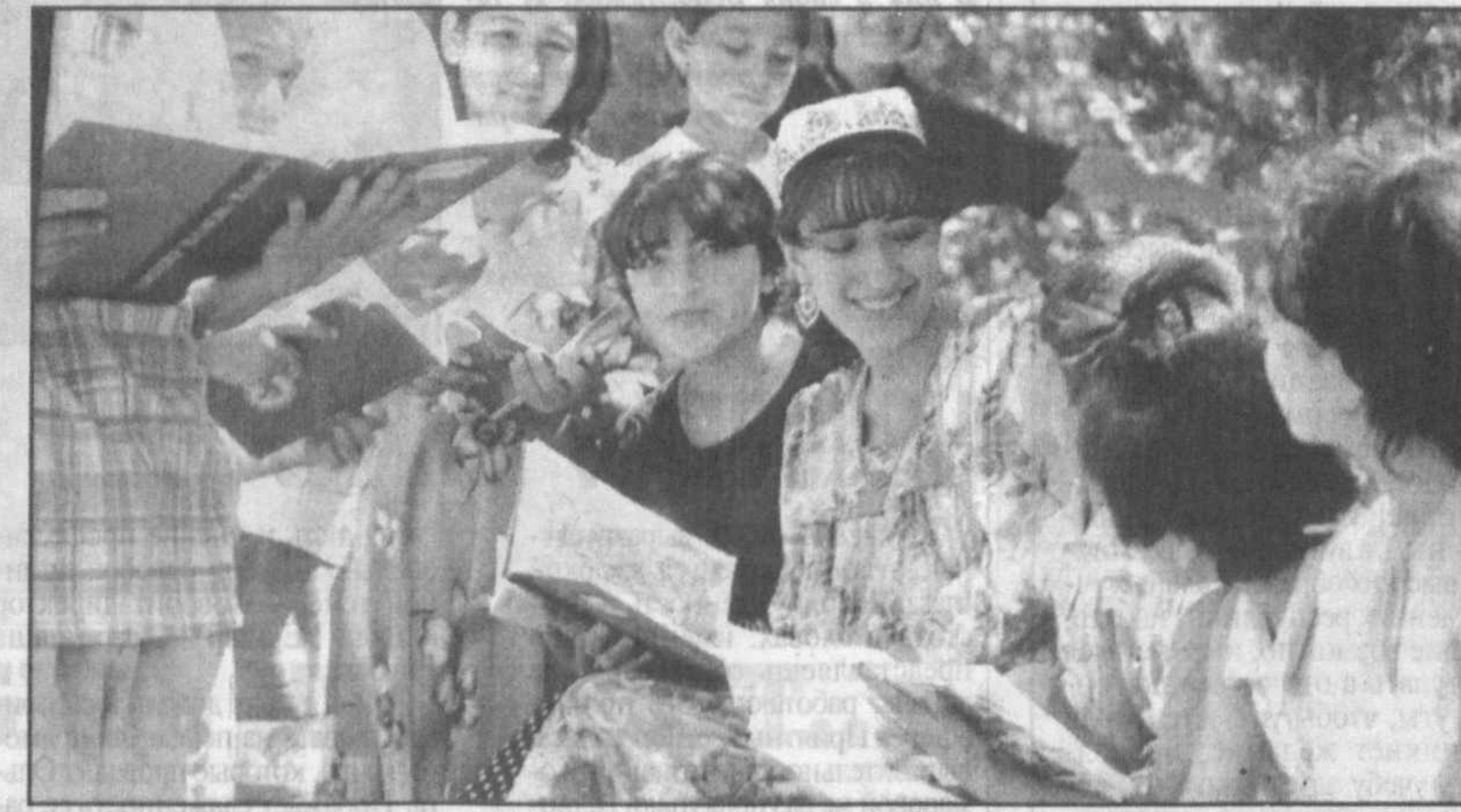
Наш корреспондент здесь нам весело и интересно.