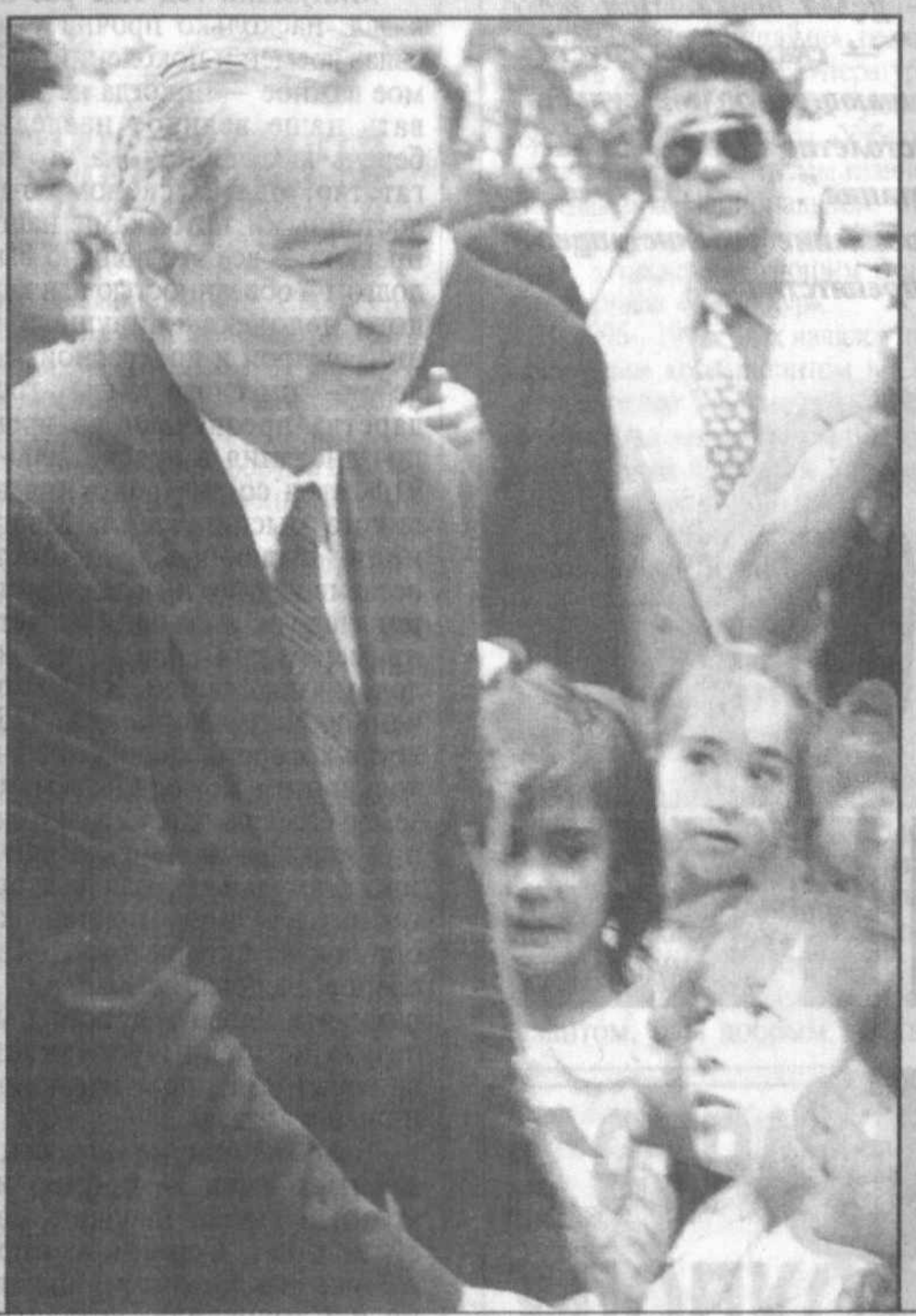
2000 год по инициативе Президента Республики Узбекистан Ислама Каримова был объявлен в нашей стране Годом здорового поколения.

Газета Олий Мажлиса Республики Узбекистан и Кабинета Министров Республики Узбекистан