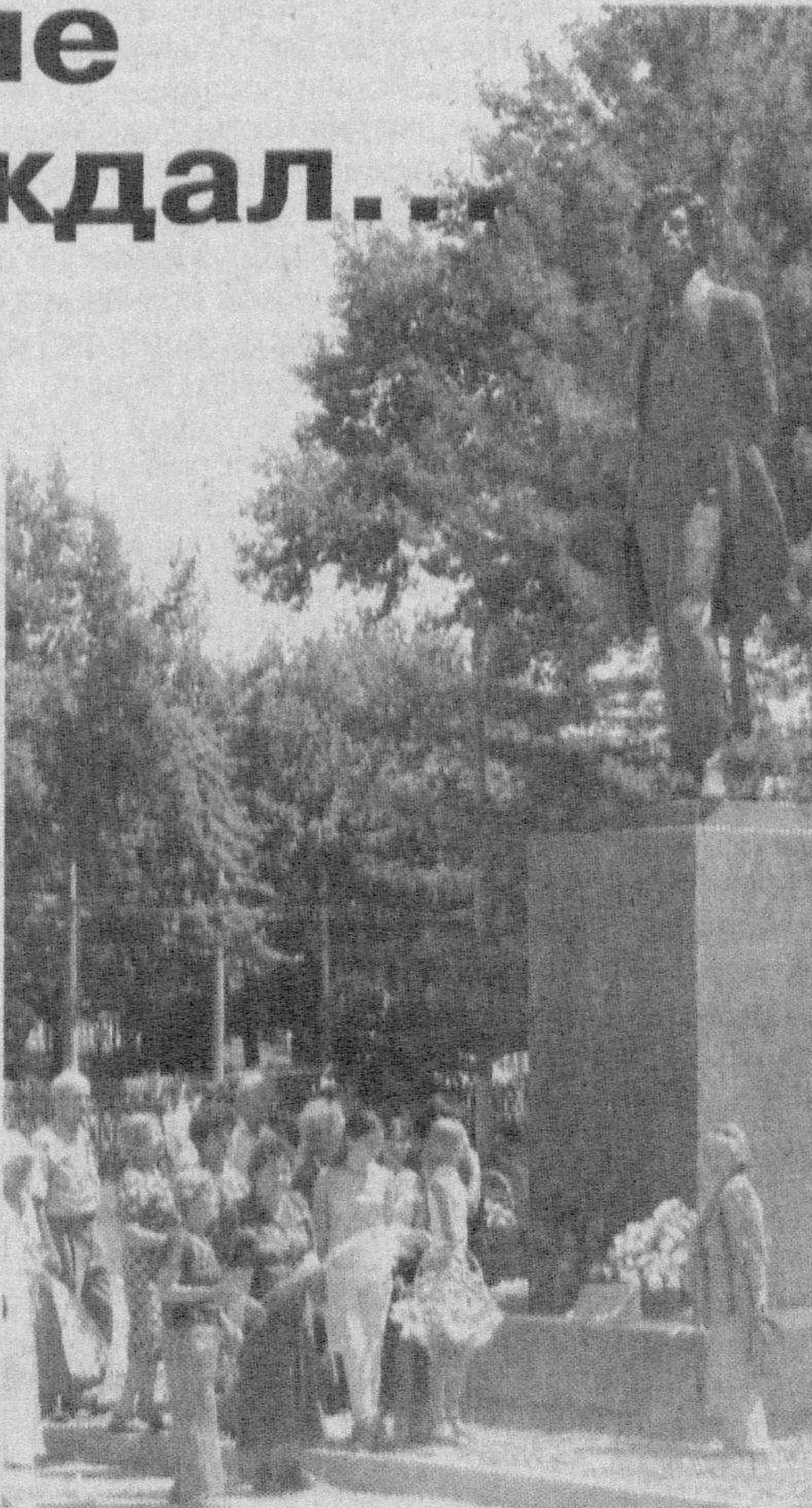
Наш корр. Фото Рашида ГАЛИЕВА.

Подобные празднования дня рождения Пушкина проходят в республике ежегодно. Неизменной традицией стало возложение цветов к памятнику поэта, расположенному у столичной станции метро Пушкина. Помните, ставшие хрестоматийными строки “Я памятник себе воздвиг нерукотворный...”? Именно этому “памятнику” был посвящен рукотворный скульптурный аналог. Он обосновался в центре Ташкента с 1974 года, предвещая 175-летний юбилей поэта. Автором его является известный российский художник и скульптор Михаил Аникушин. Поэт словно застыл в порыве творческого вдохновения. Говоря профессиональным языком, в скульптуре воплощен уникальный “эффект прорыва”. Курчавые волосы словно развеваются на ветру. А в думах — волшебные ритмы, что пробуждают в душах миллионов потомков чувства добрые.