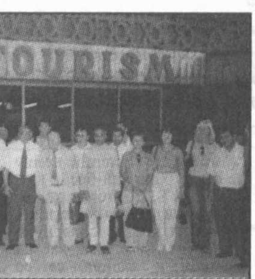
Людмила ГОРБУНОВА, наш корр. НА СНИМКЕ: группа участников.

А делается в этом плане очень много. Помимо выявления наркоманов посредством совместных рейдов, создания специальных центров, пресечения провоза наркотиков транзитом из сопредельных стран, многоплановой разъяснительной работы в Узбекистане, к