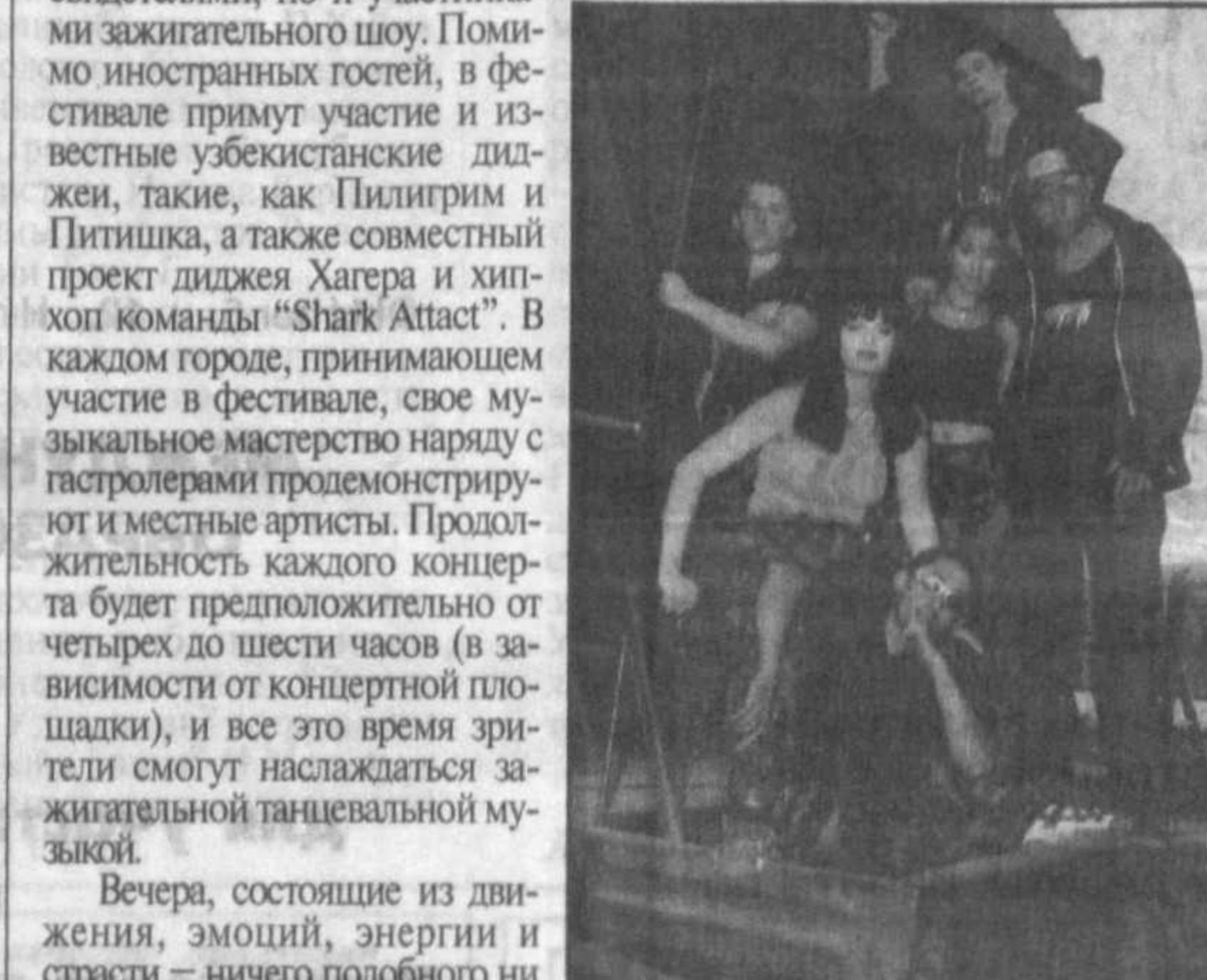
Что готовится, "Солнечный удар" уже в пути! (Наш корр.) НА СНИМКАХ: хип-хоп команда "Shark Attack".