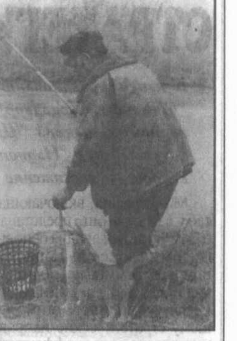
Наши братья меньшие способны к эмоциональным всплескам, похуже, ничуть не меньше, чем люди. Занятые сюжеты, которые прислал в редакцию Борис Дьякин, в свою очередь побудили читателей газеты придумать к ним веселые надписи. Кто знает, может быть, и вам удастся стать обладателем уникального кадра, запечатлев любознательную сцену из жизни природы. И вполне вероятно, что ваше фото порадит в лучах других самые теплые чувства, а вместе с ними желание переключиться парой фраз, что они думают по данному поводу.