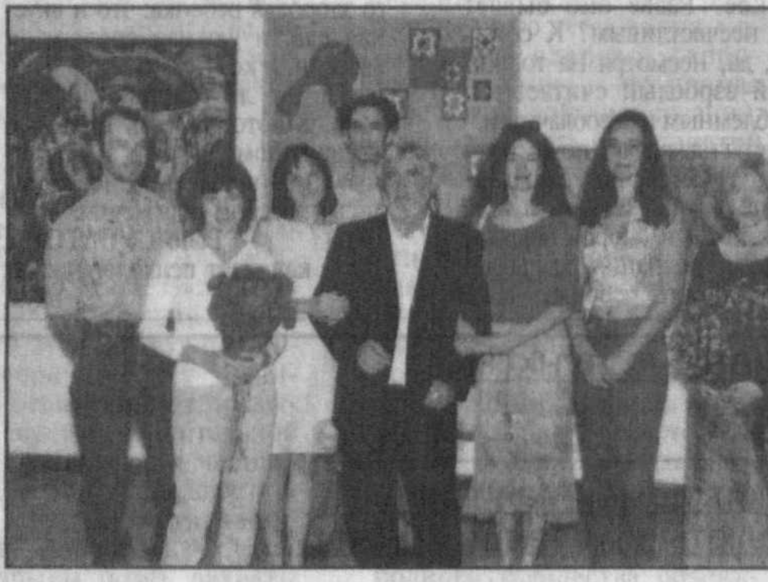
В этом году само открытие театра совпало с презентацией первой части эксклюзивного компакт-диска "Ильхом" — наши истории и наша музыка. Ему предшествовало открытие выставки молодых художников Узбекистана "Янис Салпинкиди и его школа" и "Класс рату" — вечеринка с участием лучших диджеев и рок-групп Ташкента.

Любители искусства Мельомены наверняка не пропустят открытие нового сезона театра "Ильхом", который, как и все предыдущие 25 лет своей творческой деятельности, готов дарить своим поклонникам настоящих, запоминающихся праздников. Очередной, 26-й сезон "Ильхом" начинается как всегда с множества интересных проектов.