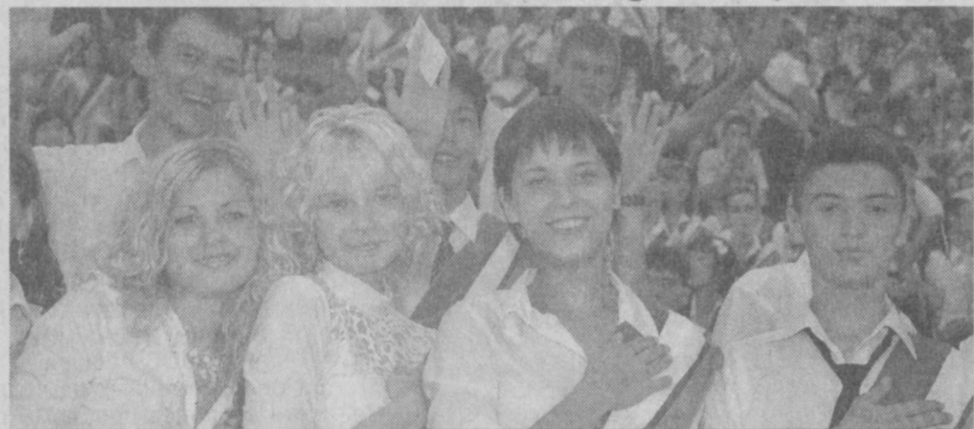
На стадионе Национального банка внешнеэкономической деятельности Республики Узбекистан состоялся фестиваль "Истиклол умидлари-2005" ("Надежды независимости-2005") выпускников общеобразовательных школ.

Мероприятие организовали хокимият города Ташкента, общественное движение молодежи Узбекистана "Камолот", министерства народного образования, по делам культуры и спорта, эстрадное объединение "Узбекинаво" и Узтелерадиокомпания.