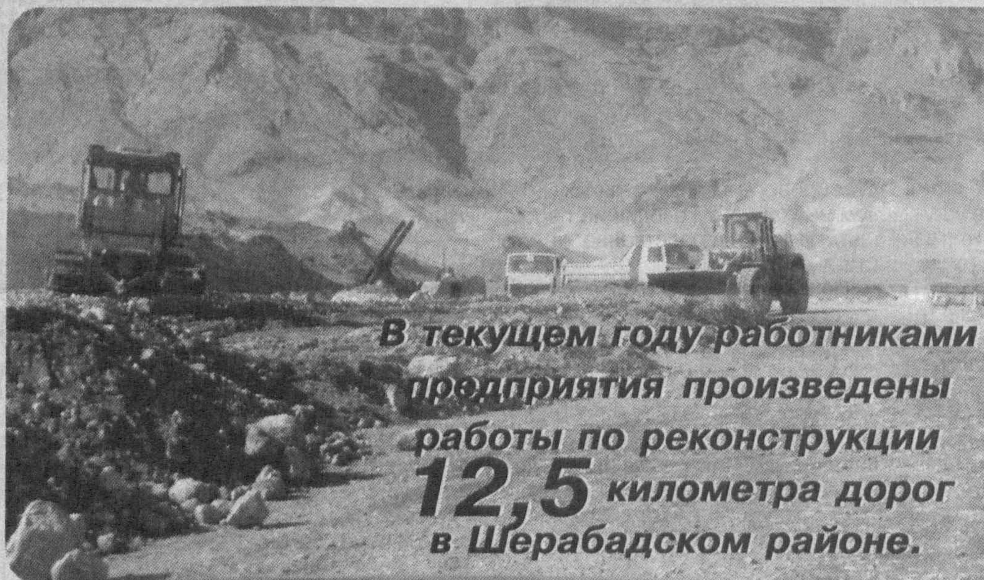
В текущем году работниками предприятия произведены работы по реконструкции 12,5 километра дорог в Шерабадском районе.

Не остались они в стороне и от строительства железной дороги Ташгузар — Байсун — Кумкурган, где осуществлены строительные монтажные работы на сумму 146,6 миллиона сумов. Всего за минувший год работниками Денауского ремонт-