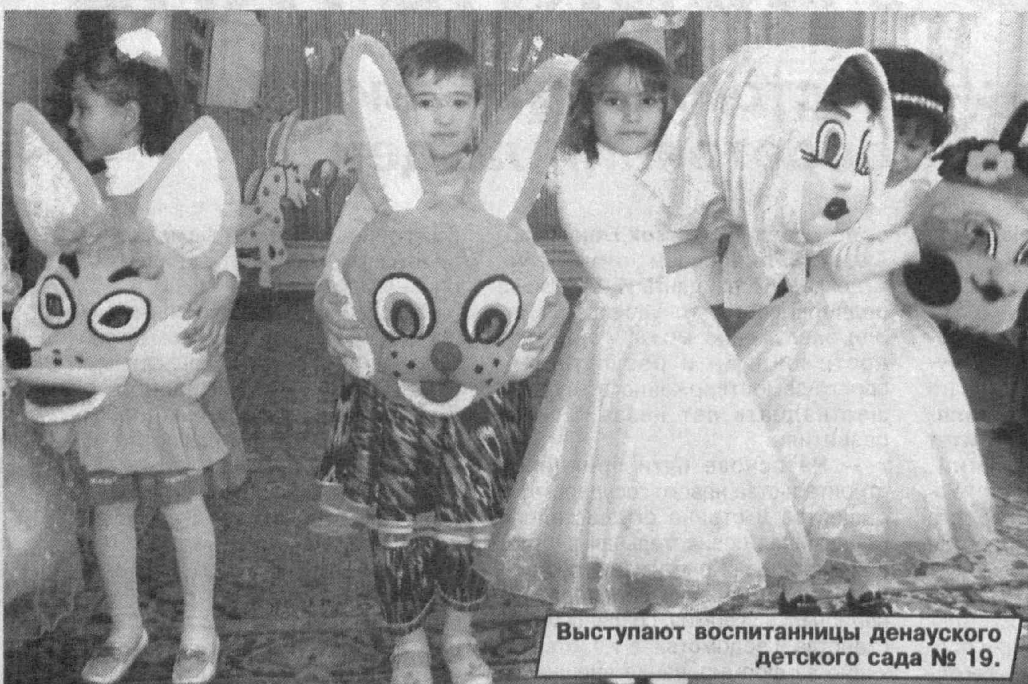
Выступают воспитанницы денауского детского сада № 19.