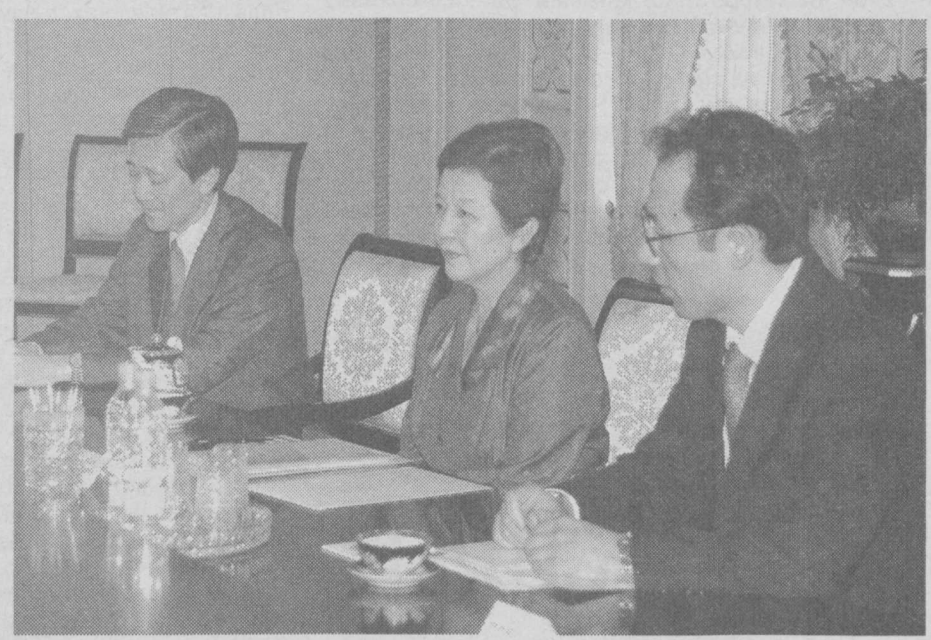
Президент Республики Узбекистан Ислам Каримов принял 14 июля в резиденции Оксарой специального посланника правительства Японии Кёко Накаяма.

— Мы воспринимает вас не только как официального представителя японского правительства, но и как верного друга Узбекистана, узбекского народа, — сказал, приветствуя гостя, руководитель нашего государства. — Ваша деятельность на посту главы в нашей стране оставила глубокий след в узбекско-японских отношениях.