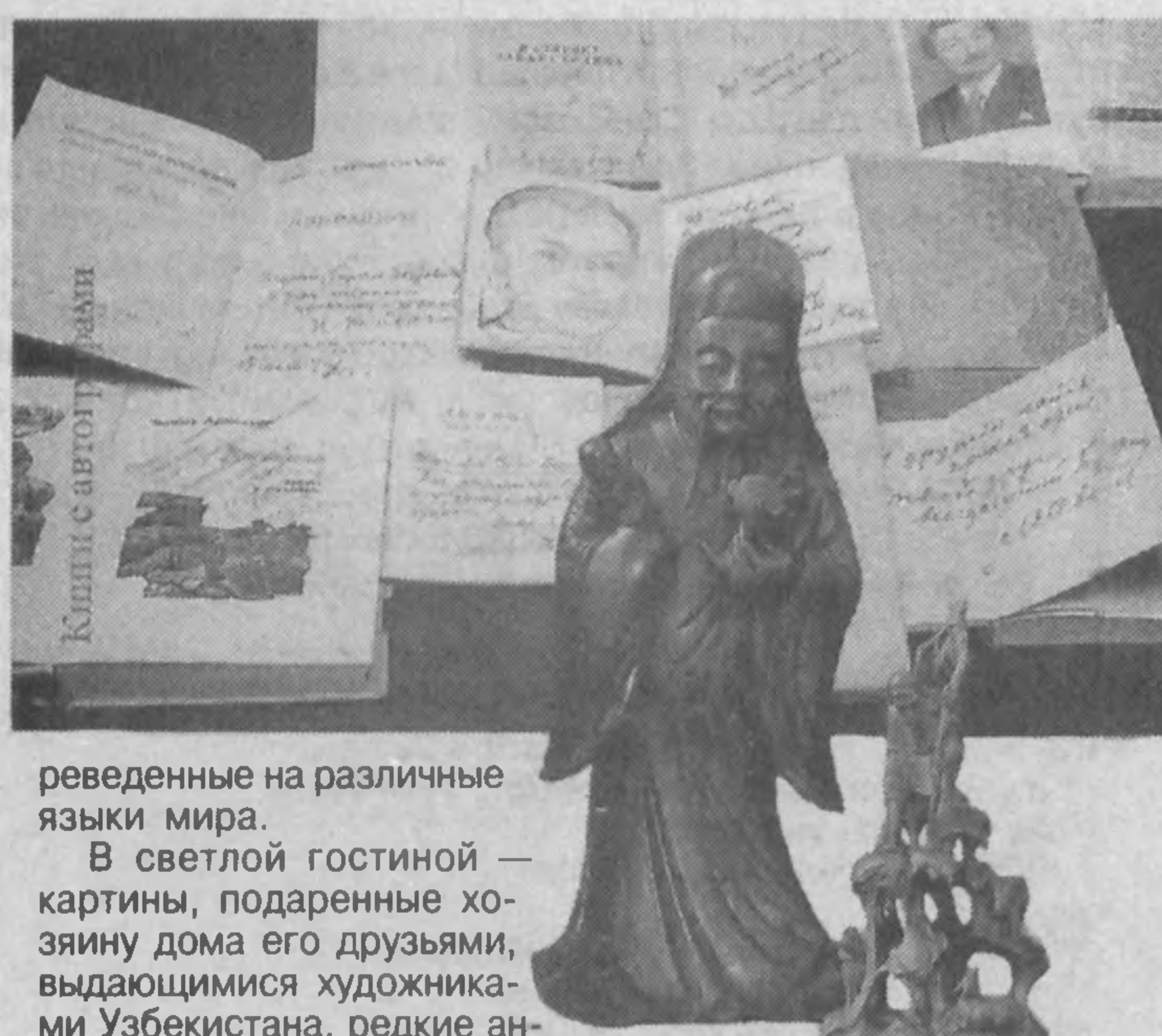
редевные на различные языки мира.

— дне смерти Сергея Бородина. Здесь же, в кабинете, старинный шкаф, в котором хранятся уникальные собрания книг с автографами знаменитых писателей и деятелей искусства, с которыми принадлежалности, фотографии в оригинальных рамках и дружил при жизни. Среди них: М. Горький, А. Ахматова, Б. Пастернак, Кемал Тахир, Ирвинг Стоун и другие. Библиотека, насчитывающая более семи тысяч книг, хранит следы напряженного писательского труда, почти в каждой книге есть его заметки. Здесь и труды по истории и археологии, редкие издания, энциклопедии, каталоги по искусству и, конечно же, многочисленные издания произведений самого писателя, пе-