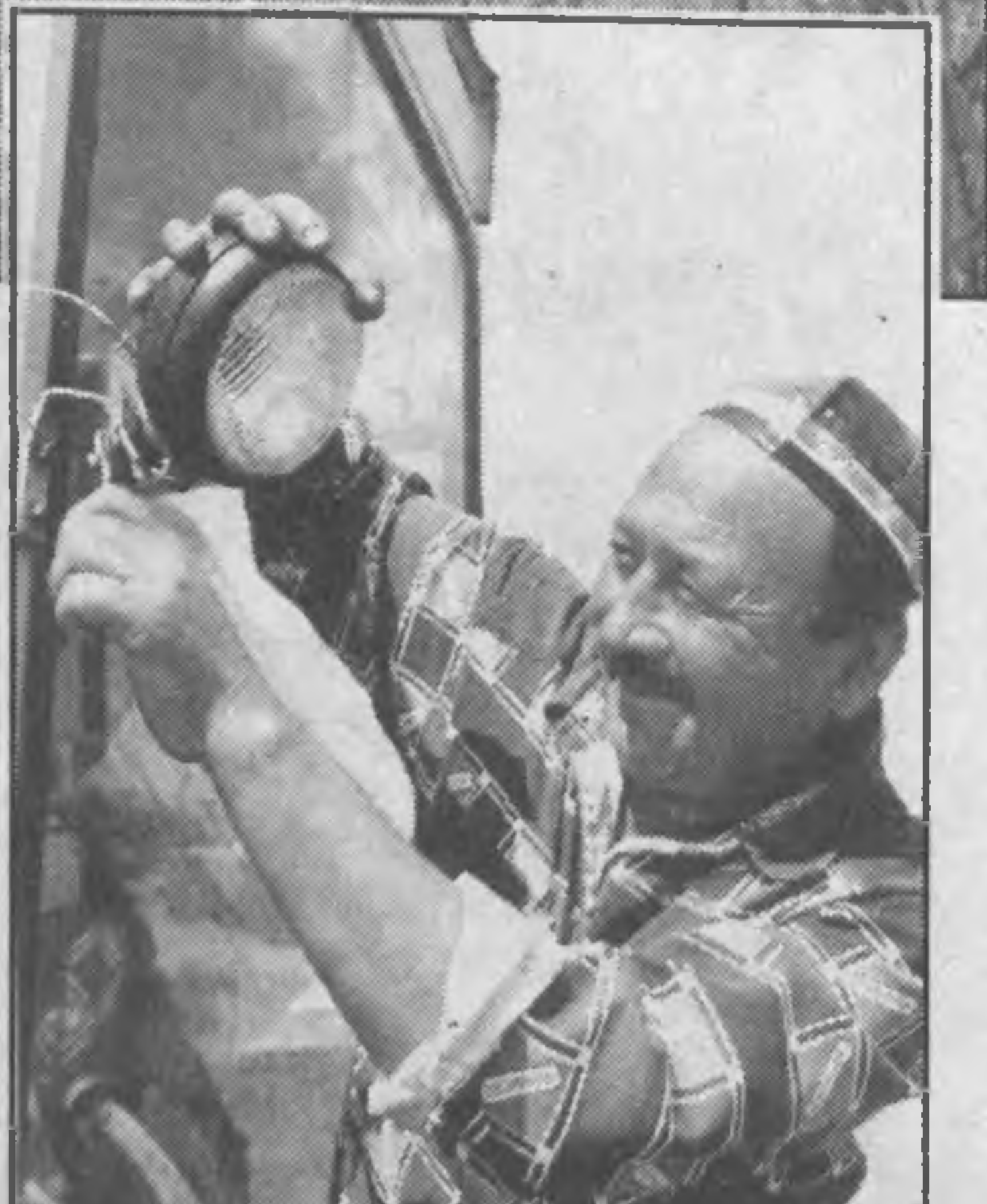
Фермеры в поле