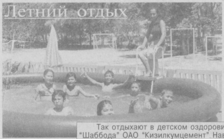
Так отдыхают в детском оздоровительном лагере "Шаббода" ОАО "Кизилкумцмент" Навоийской области.