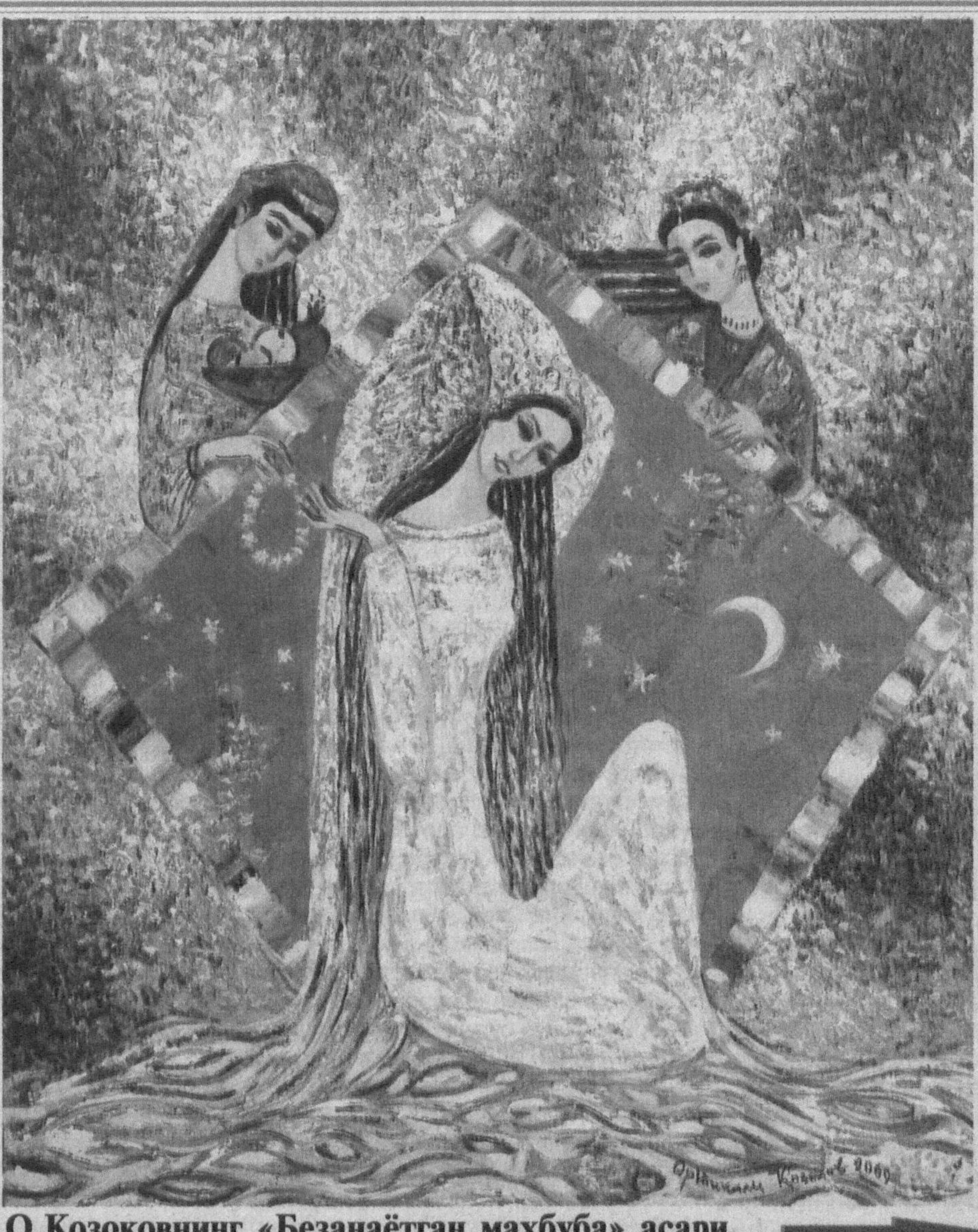
О.Қозоқовнинг «Безана'атган махбуба» асари.