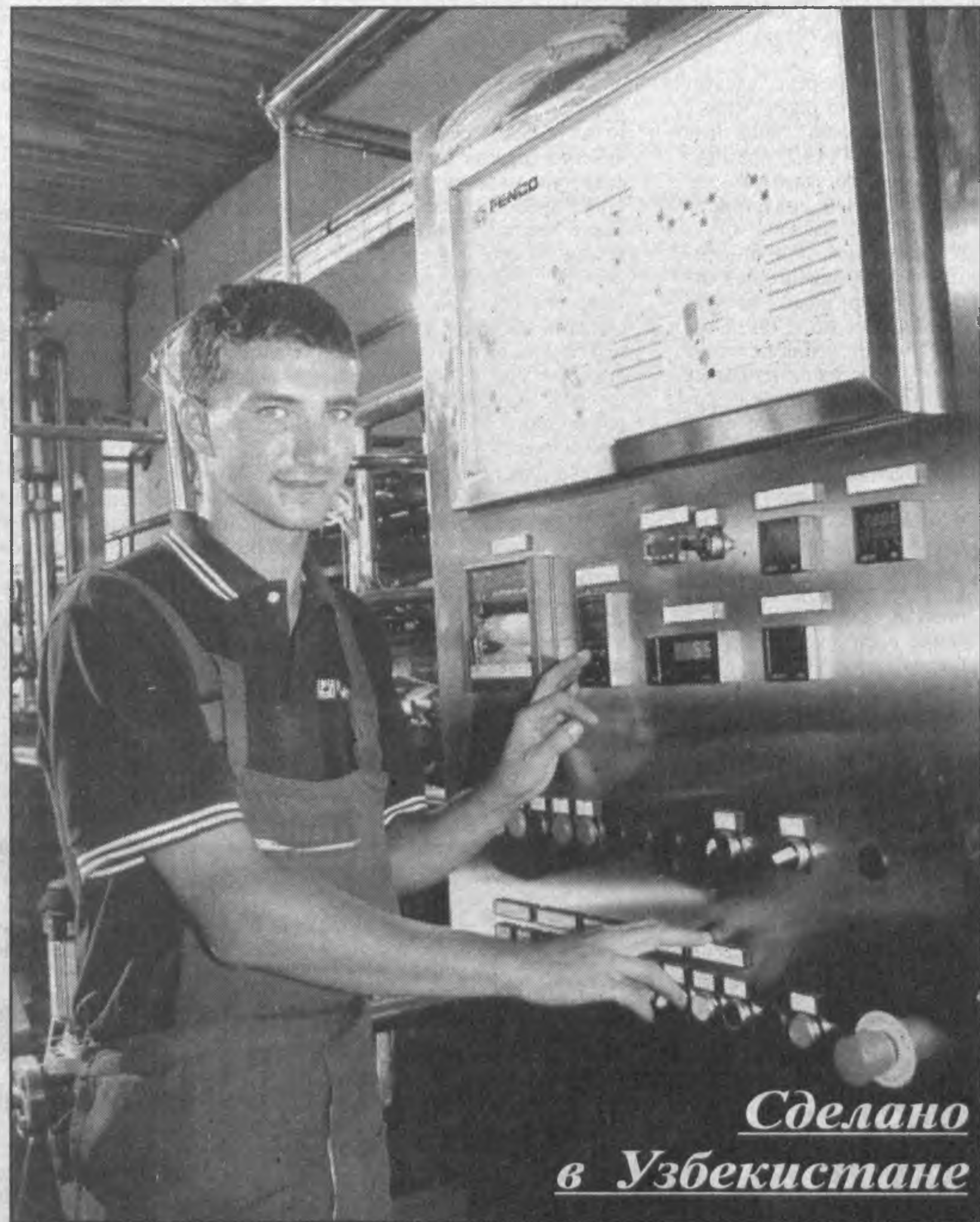
Сделано в Узбекистане

По сообщениям наших корреспондентов и информационных агентств.