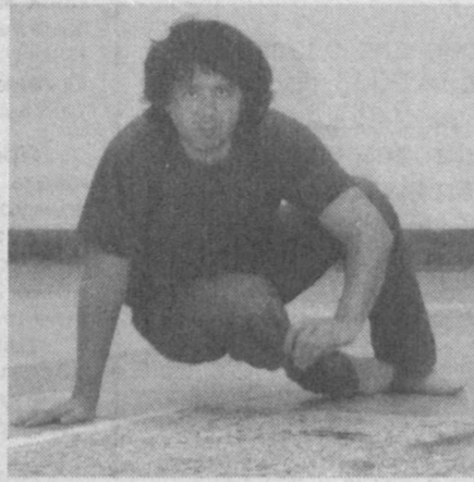
Прибывшие зарубежные художники размещают свои работы.