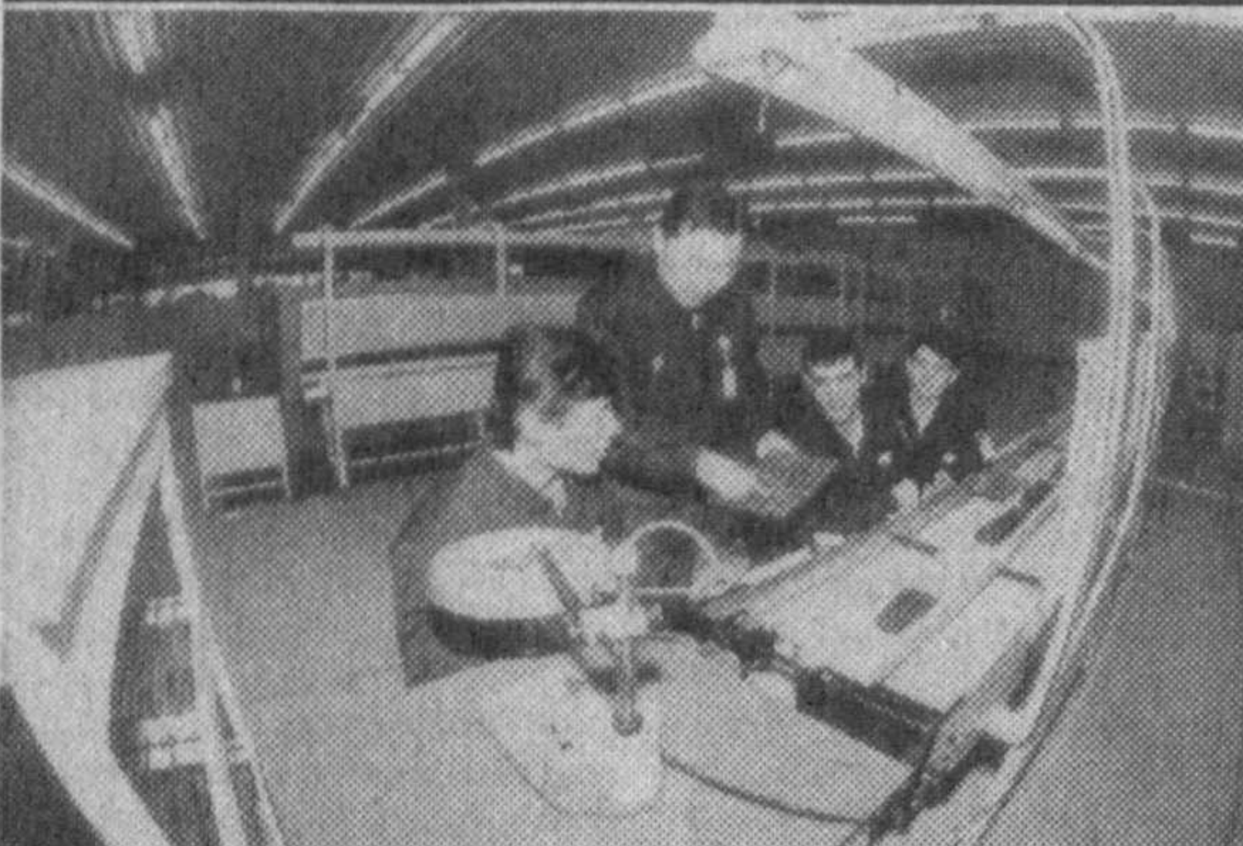
«Алока-ДЭУ» производит оборудование для связи