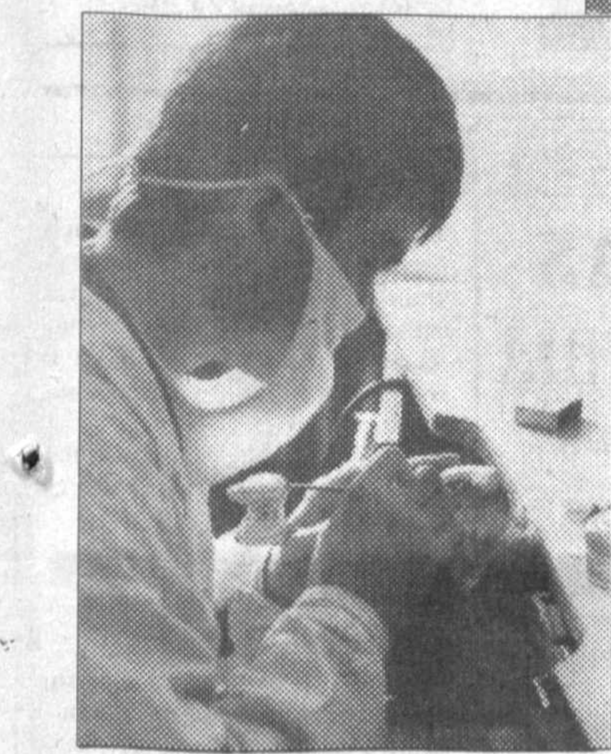
Его пациентами станут не только около двухсот сотрудников АО «Узбекбирлашув», но и жители прилегающей территории.

На днях здесь открылся филиал Республиканского стоматологического центра, оснащенный современным оборудованием из Чехии. Лечить, удалять, протезировать зубы, а при необходимости производить косметические операции высокопрофессиональные специалисты центра будут с помощью новейших