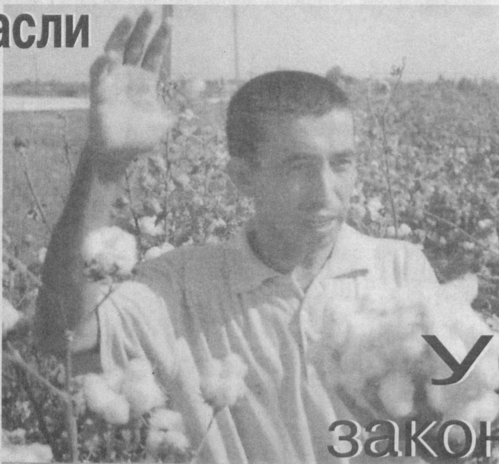
Впервые за много лет Папский район Наманганской области выполнил договорные обязательства по заготовке хлопка.