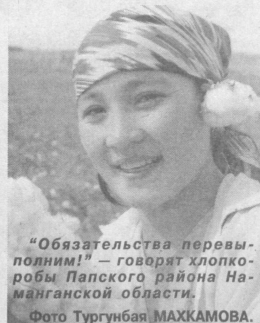
“Обязательства перевыполнили!” — говорят хлопкоробы Папского района Наманганской области.