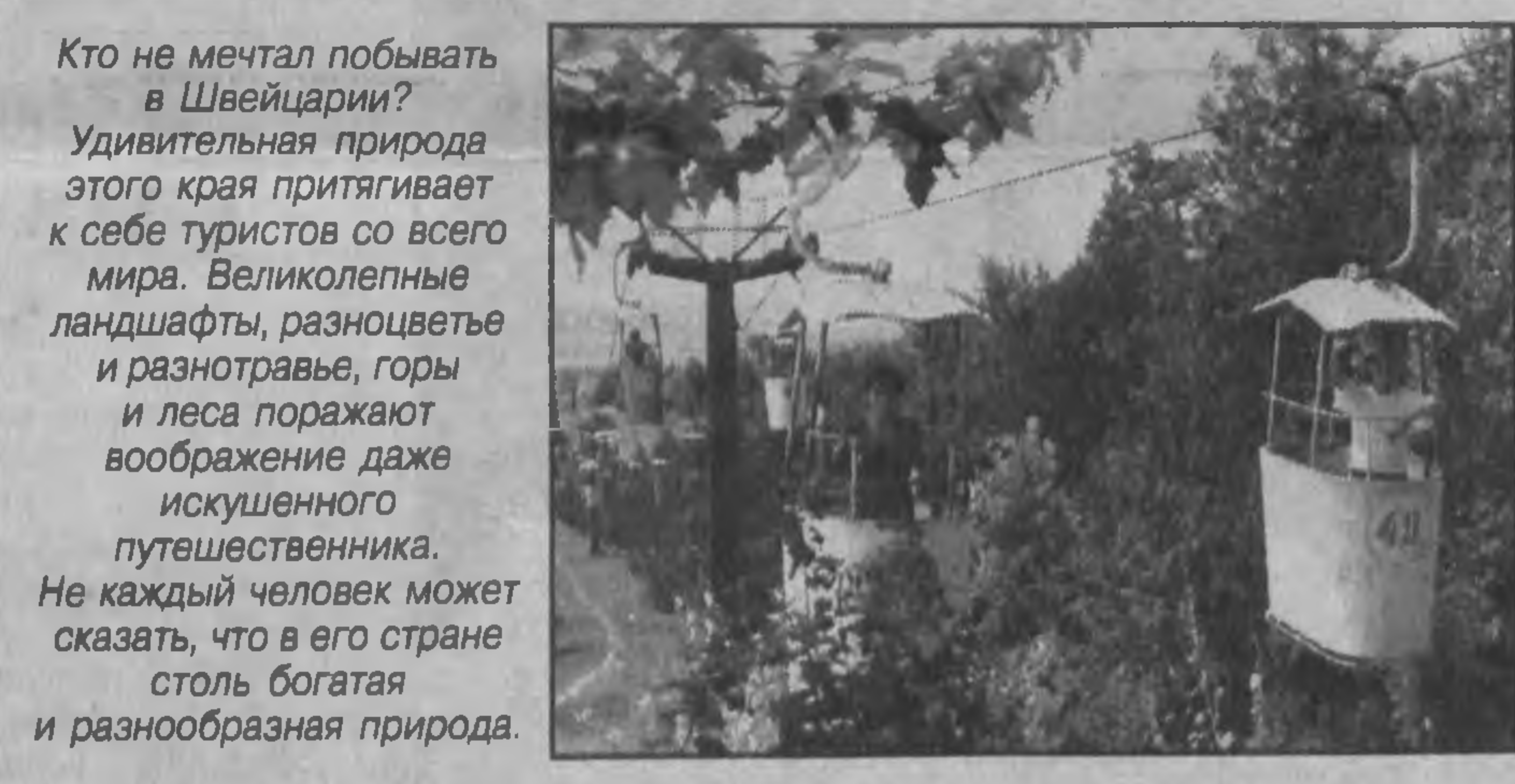
Кто не мечтал побывать в Швейцарии? Удивительная природа этого края притягивает к себе туристов со всего мира...