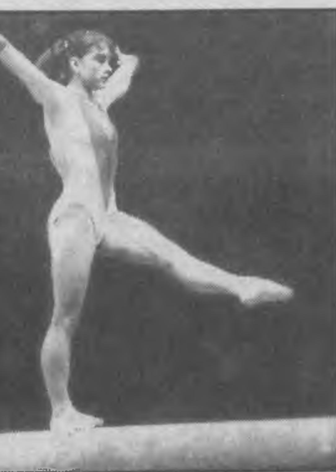
Андрей КИМ, наш корр.