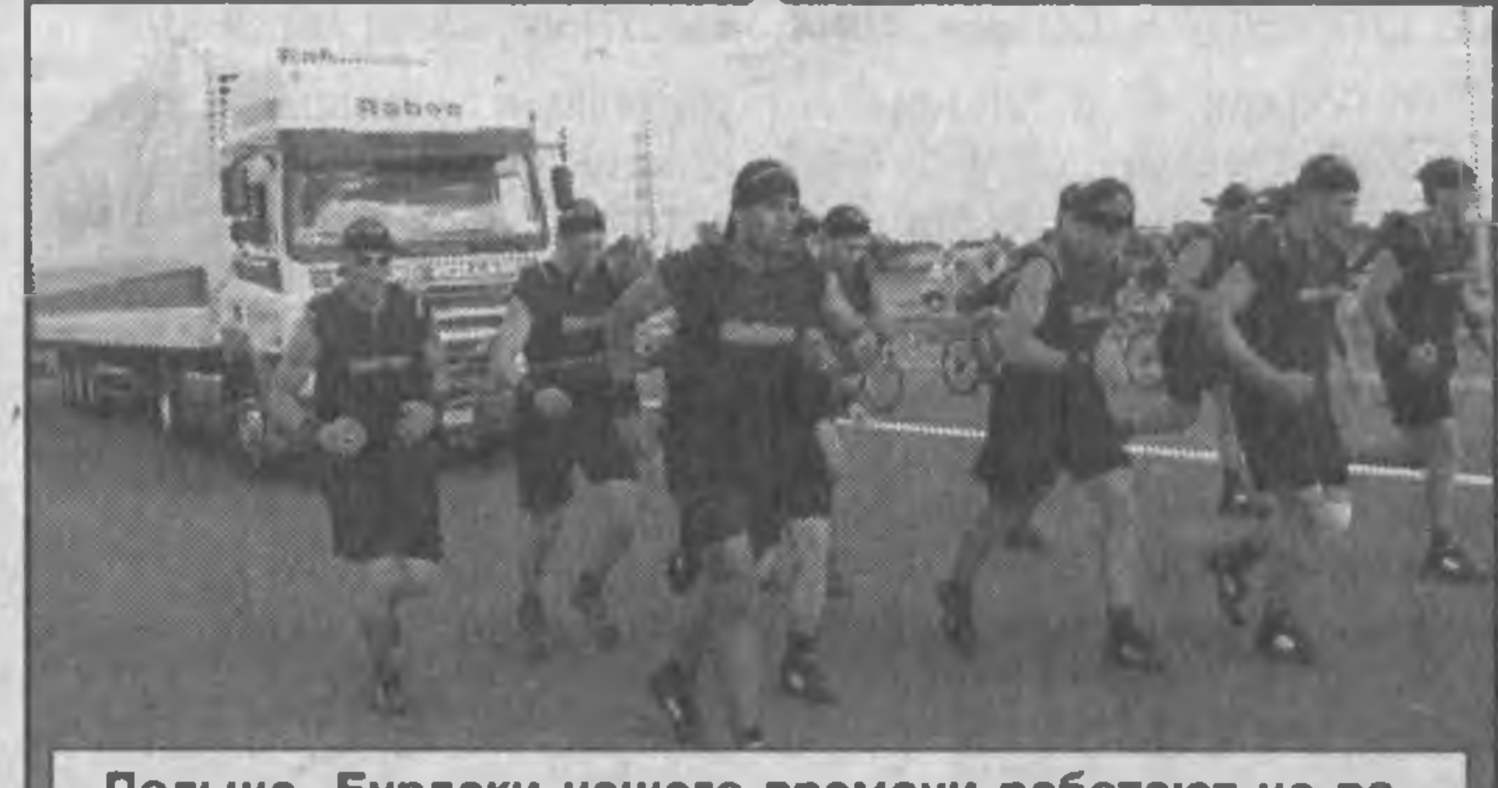
Польша. Бурлаки нашего времени работают на рекорд — достижение для книги рекордов Гиннеса установили 20 поляков, впрягшись в ямки и протаскивая грузовой весом 16,6 тонны. За час они сумели откатить трейлер почти на 6 км (5,950 м).