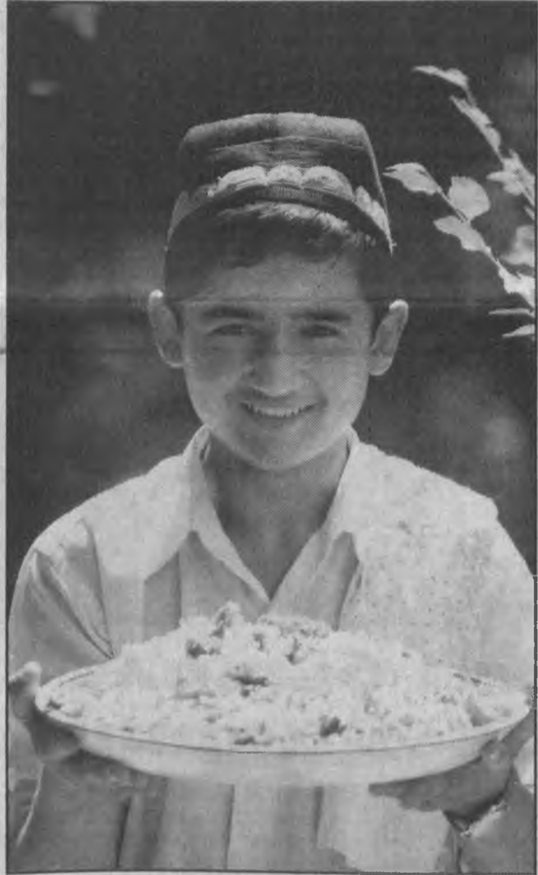
Ни одно торжество не проходит без праздничного угощения. Обязательным атрибутом такого дастархана всегда становится ароматный плод.

В преддверии 12-летия независимости Узбекистана Министерство высшего и среднего специального образования из своих внебюджетных средств выделило домам милосердия и специализированным интернатам республики 8,5 миллиона сумов. Деньги предназначены для оказания социальной поддержки воспитанникам этих учреждений и организации их подготовки к новому учебному году. Нынешняя акция — часть постоянно действующей программы шефства, реализуемой министерством. В ней участвуют все высшие учебные заведения страны. В праздничные дни в каждом доме милосердия и специализированном интернате будут накрыты дастарханы с ароматным плодом. Шефы из вузов не только сами придут с подарками, но и пригласят на встречу с детьми известных писателей и артистов. Их тоже ждут сюрпризы — юные воспитанники подготовили для гостей концерты и театрализованные представления. Будет звучать много стихов и песен, посвященных свободной Родине, нашему народу, веками борющемуся за независимость и завоевавшему ее 12 лет назад.