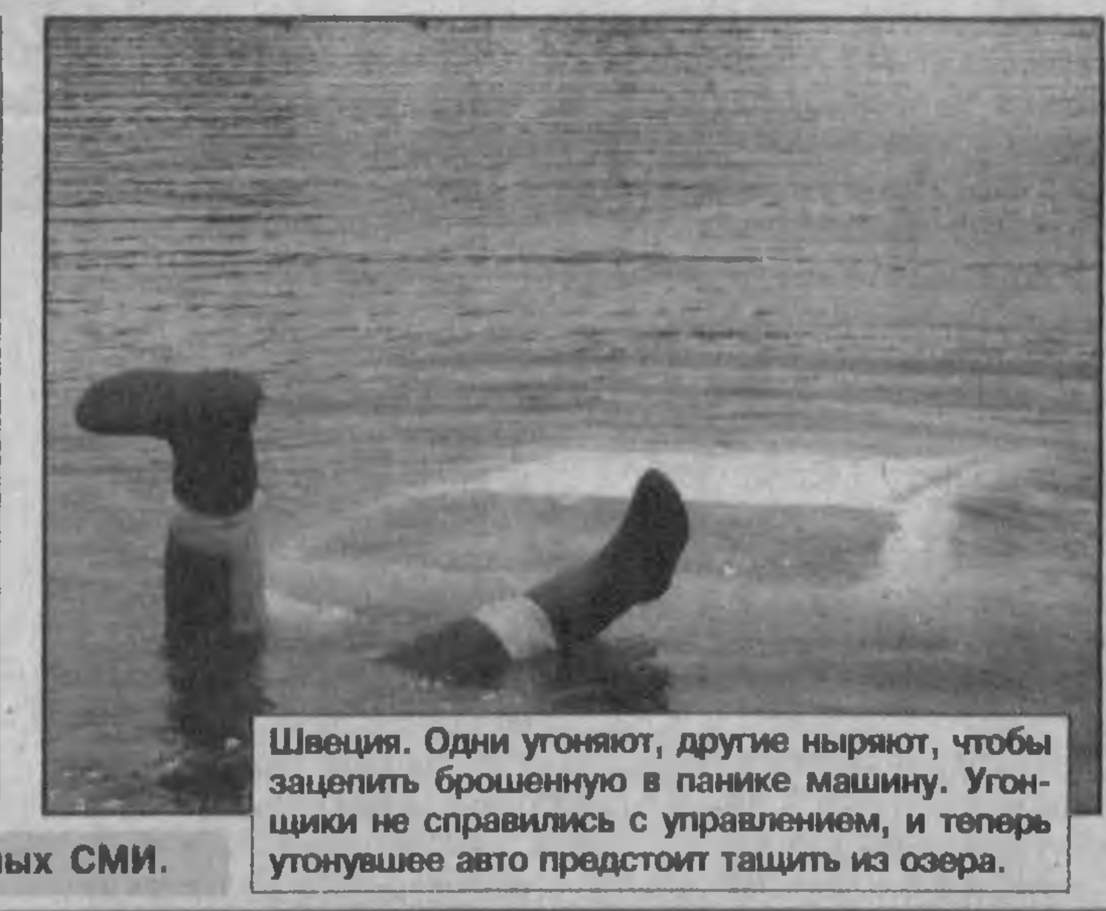
Подготовлено по материалам зарубежных СМИ.

Специально созданная Белым домом рабочая группа американских экспертов приступит в ближайшую неделю к подготовке планов пилотируемых космических полетов к другим планетам. Об этом со ссылкой на газету «Вашингтон пост» сообщает РИА «Новости». Представитель Белого дома подтвердил газете, что рабочая группа начнет рассмотрение данного вопроса на концептуальном уровне, затрагивая такие аспекты будущей космической программы США, как «роль военного космоса, приоритеты между пилотируемыми и беспилотными полетами и целесообразность строительства базы в космосе». Будет изучать-