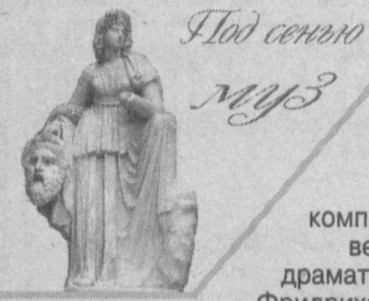
Под сенью Муз

На сцене театра им. Абнора Хидоятова Немецкий культурный центр Узбекистана "Wiedergeburt" ("Возрождение") представил вокально-поэтическую композицию, посвященную памяти великого немецкого поэта, драматурга, философа, публициста Фридриха Шиллера (1759 — 1805 гг.) и приуроченную к 15-летию Немецкого культурного центра. Вокально-поэтическая композиция "Фридрих Шиллер — знакомый незнакомец" звучала на двух языках — немецком и русском. Вечер организован при поддержке Посольства Германии в Узбекистане.